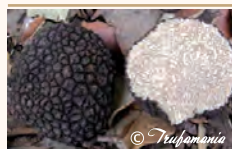
Trufa de verano ( Tuber aestivum )