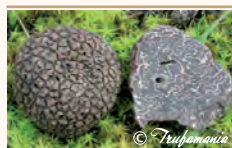
Trufa china ( Tuber indicum )

Aprenda a identificar la auténtica trufa negra de Soria ( Tuber melanosporum )