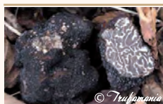
Trufa machena ( Tuber brumale )