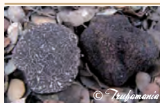
Trufa negra ( Tuber melanosporum )