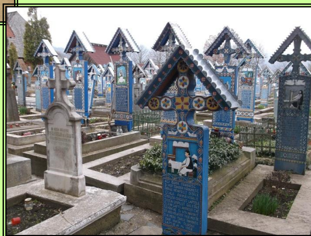
Cementerio Alegre- Rumanía