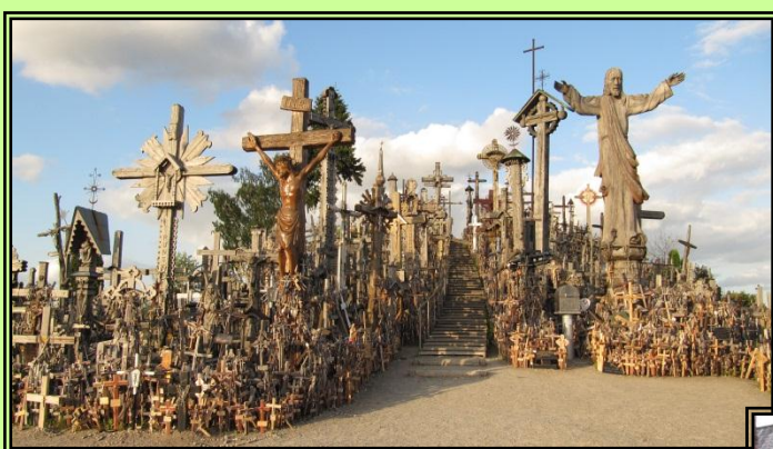
Colina de las Cruces- Lituania

Fuentes de inspiración de El Bosque Alegre: