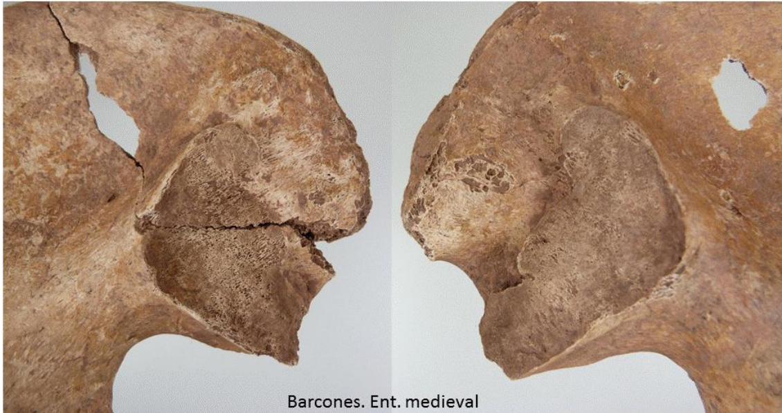
Barcones. Ent. medieval Superficies auriculares de los coxales.

No se han observado signos ni lesiones patológicas en el hueso.