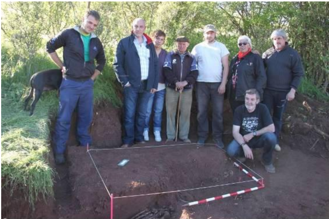
Vecinos de Barcones junto a la fosa.