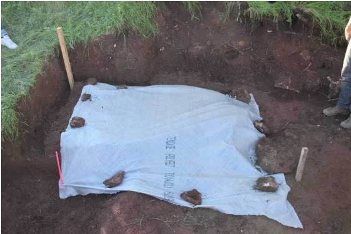
Geotextil colocado sobre la fosa con el fin de proteger el espacio.