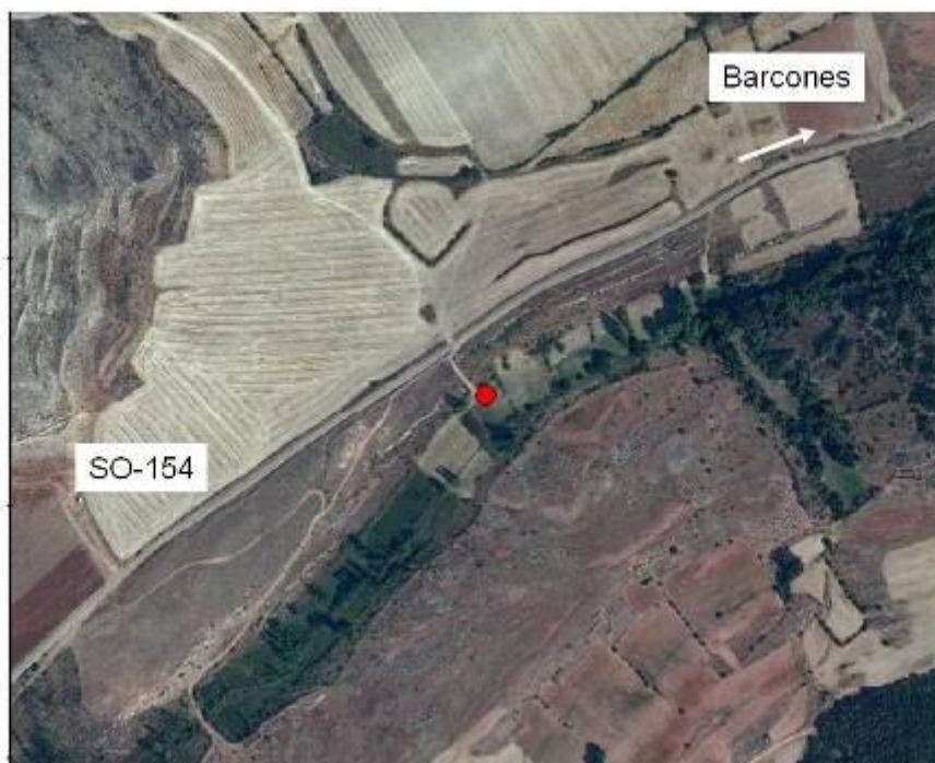
El punto rojo señala la localización de la fosa.

Por información previa documentada consta que en este municipio fueron asesinadas diez personas en agosto de 1936 siendo enterradas en dos fosas comunes contiguas. Ninguna de ellas era del municipio.