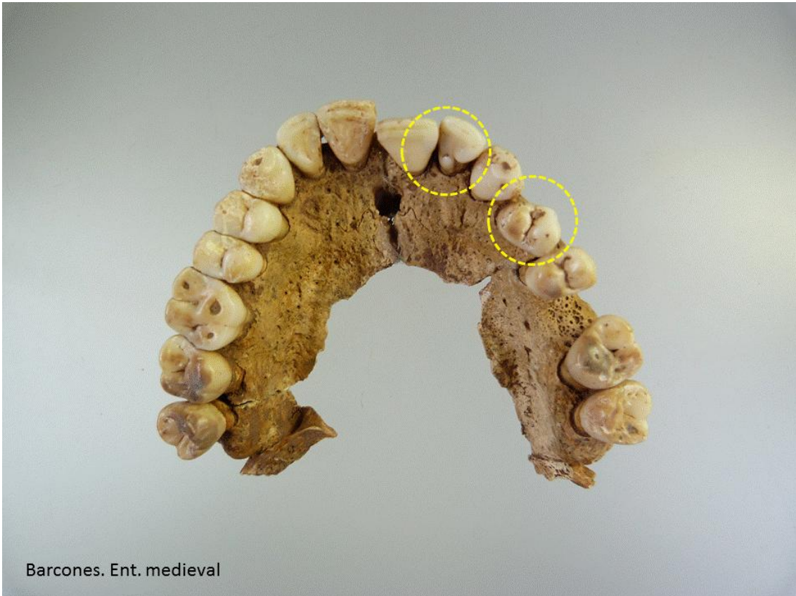
Tubérculo como variante en 22. Premolar 24 rotado 45°.