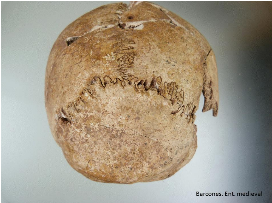
Occipital. Sutura sagital y lambda abiertas.