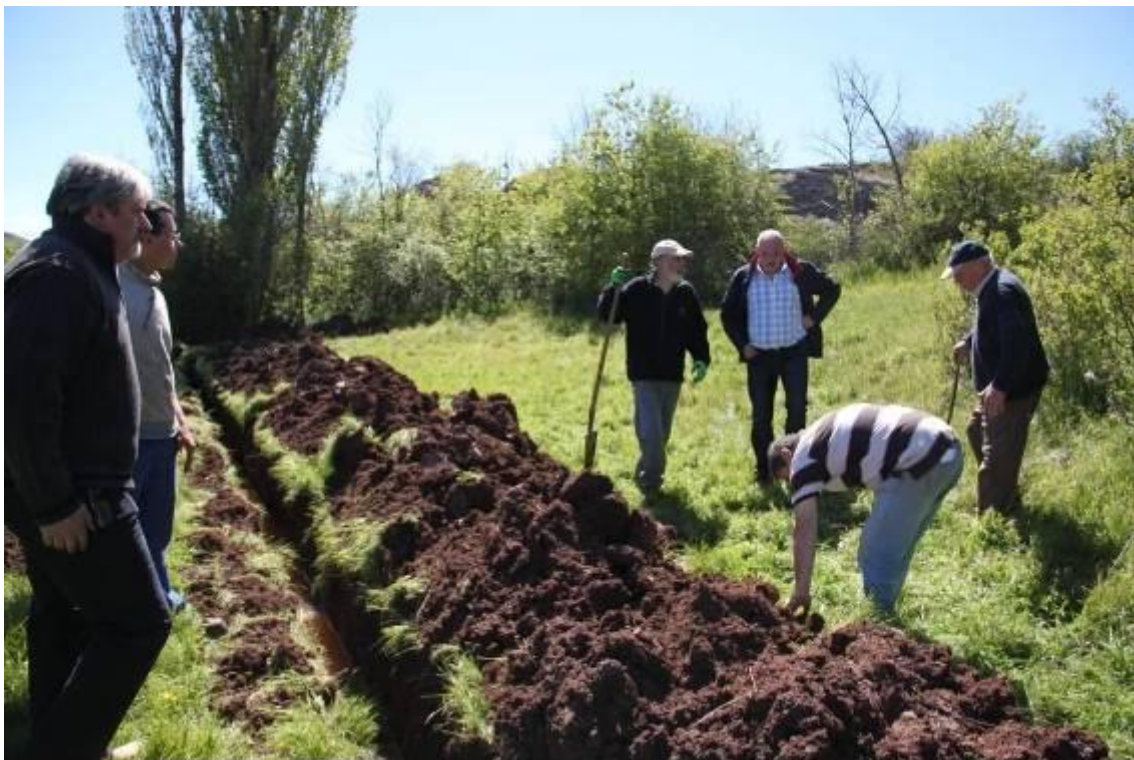
Zanjas realizadas en la prospección.