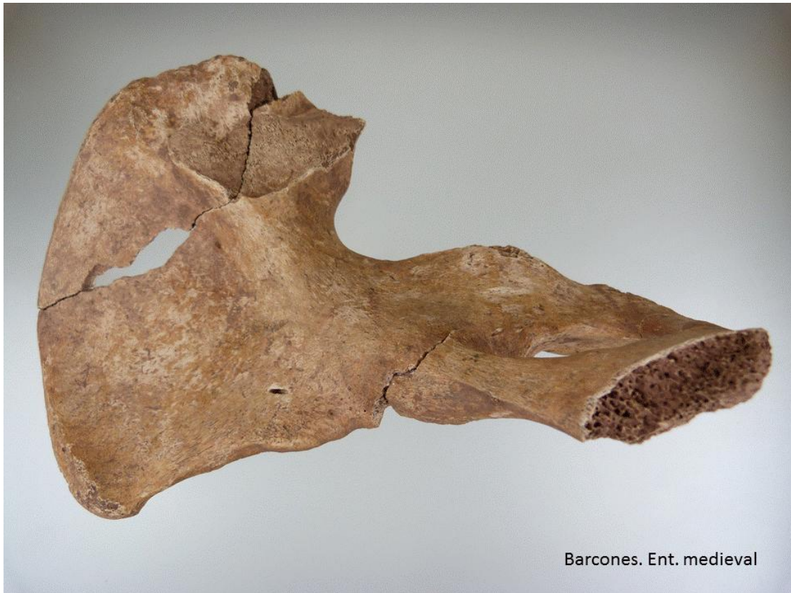
Individuo de sexo femenino por la escotadura ciática.