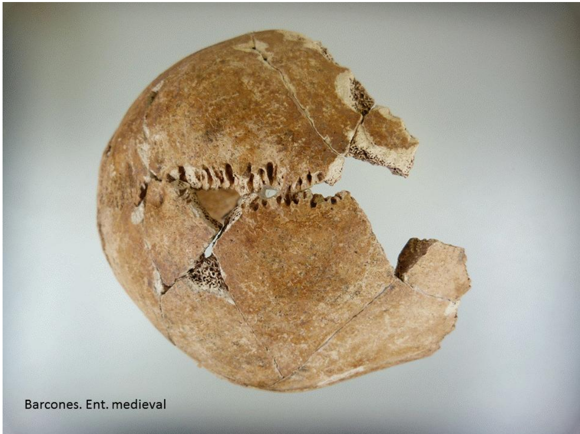
Neurocráneo. Suturas abiertas.