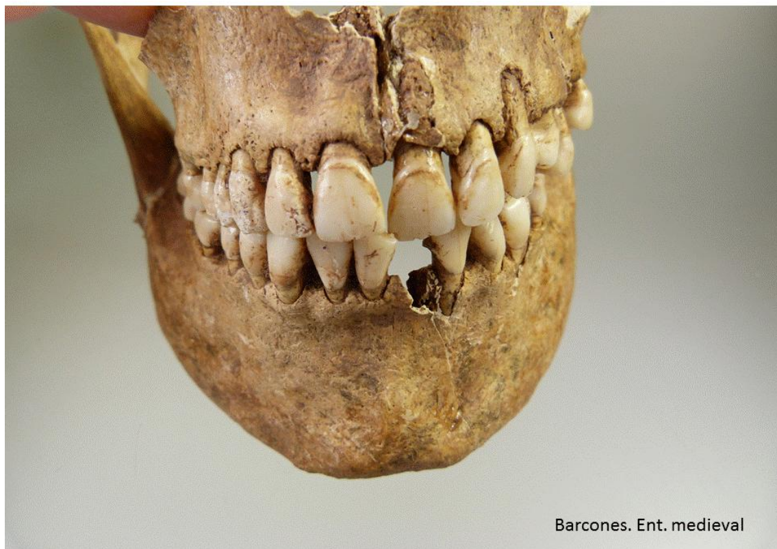
Oclusión anterior de los maxilares.