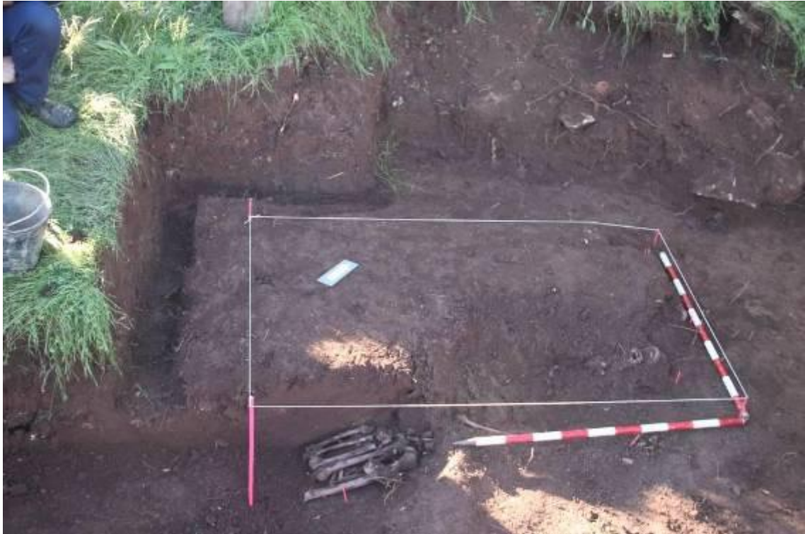
Delimitación de la fosa.