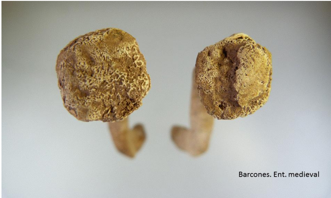
Epífisis medial de las clavículas sin soldar. Pérdida de la misma en lado izquierdo.