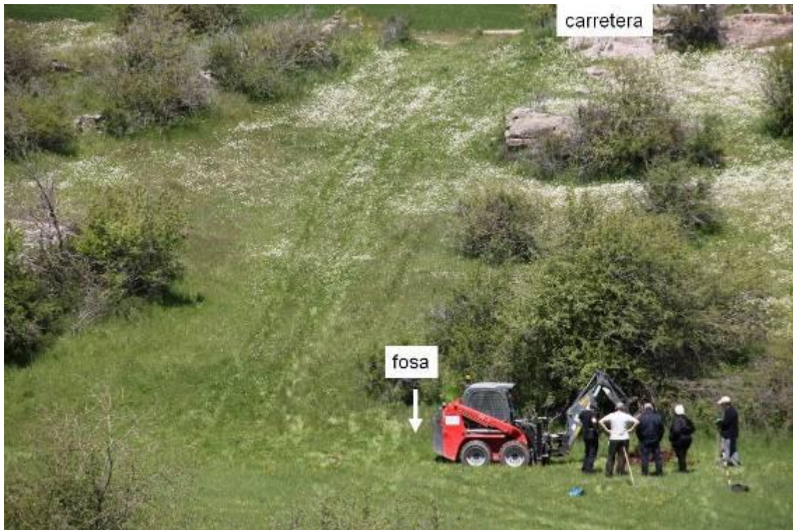
Localización de la fosa.