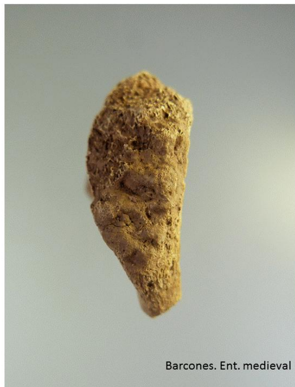
Barcones. Ent. medieval Carilla sinfisaria del coxal derecho.