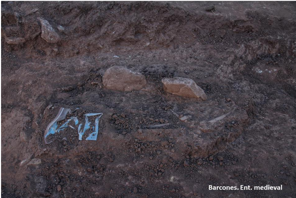
Hallazgo de los primeros huesos.