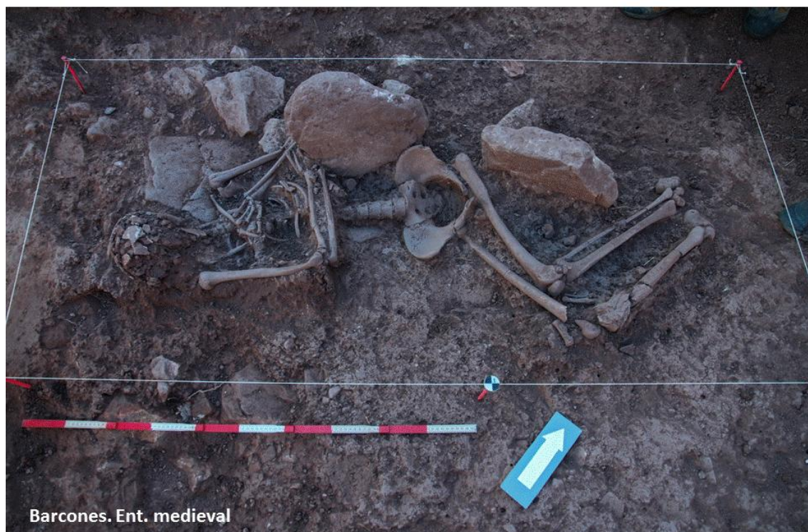
Disposición del individuo en el enterramiento.