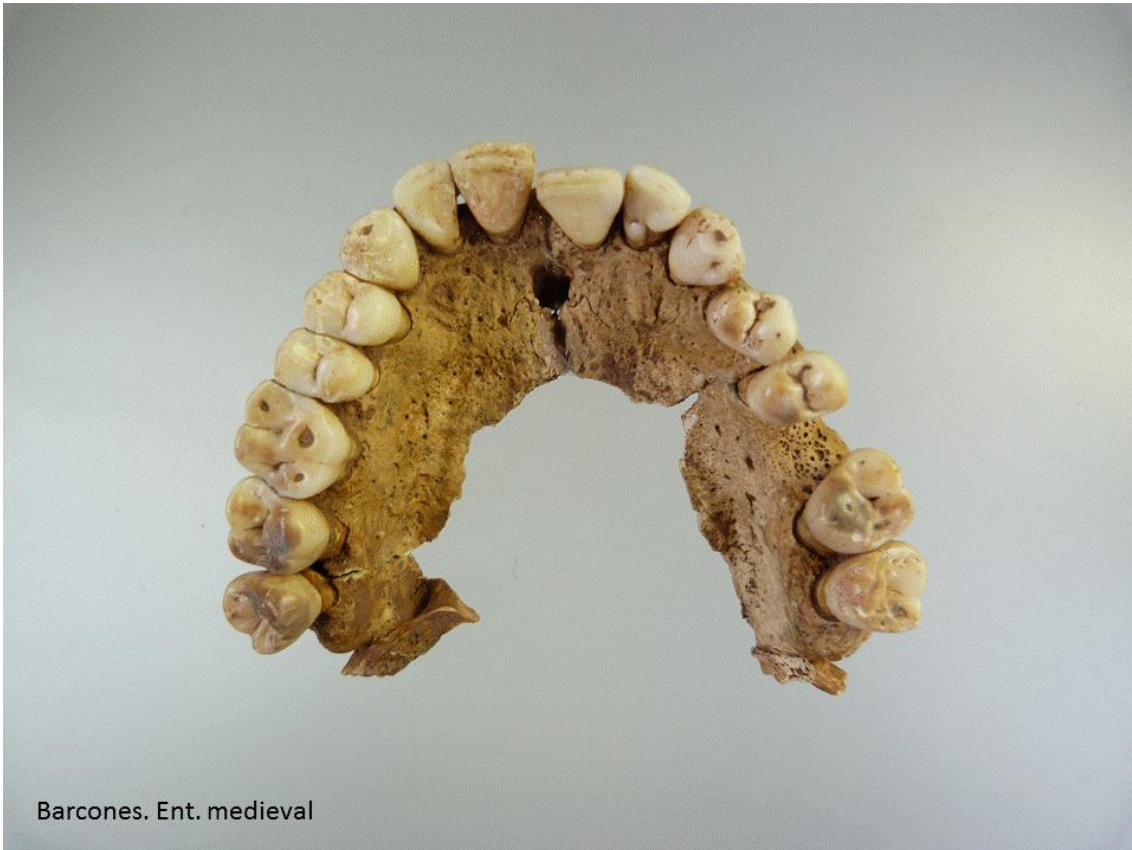
Maxilar superior. Pérdida en vida de molar 26. Desgas en molares.