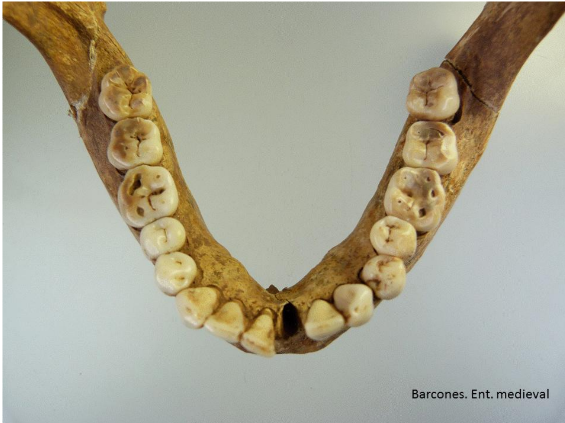
Barcones. Ent. medieval

Desgaste en superficie oclusal de los molares, particularmente en 36 y 46.