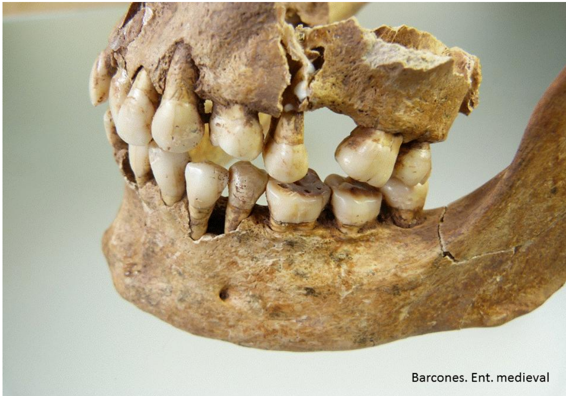
Oclusión en el lado izquierdo.