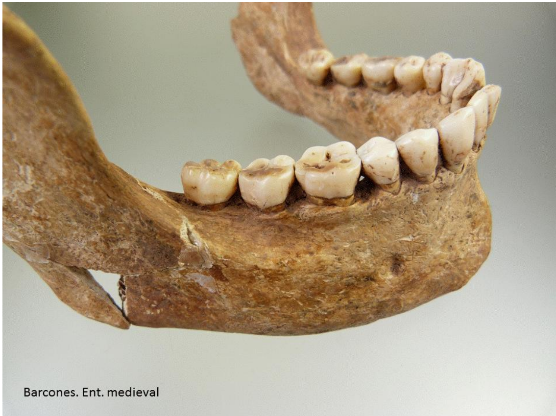
Vista lateral derecha de la mandíbula.