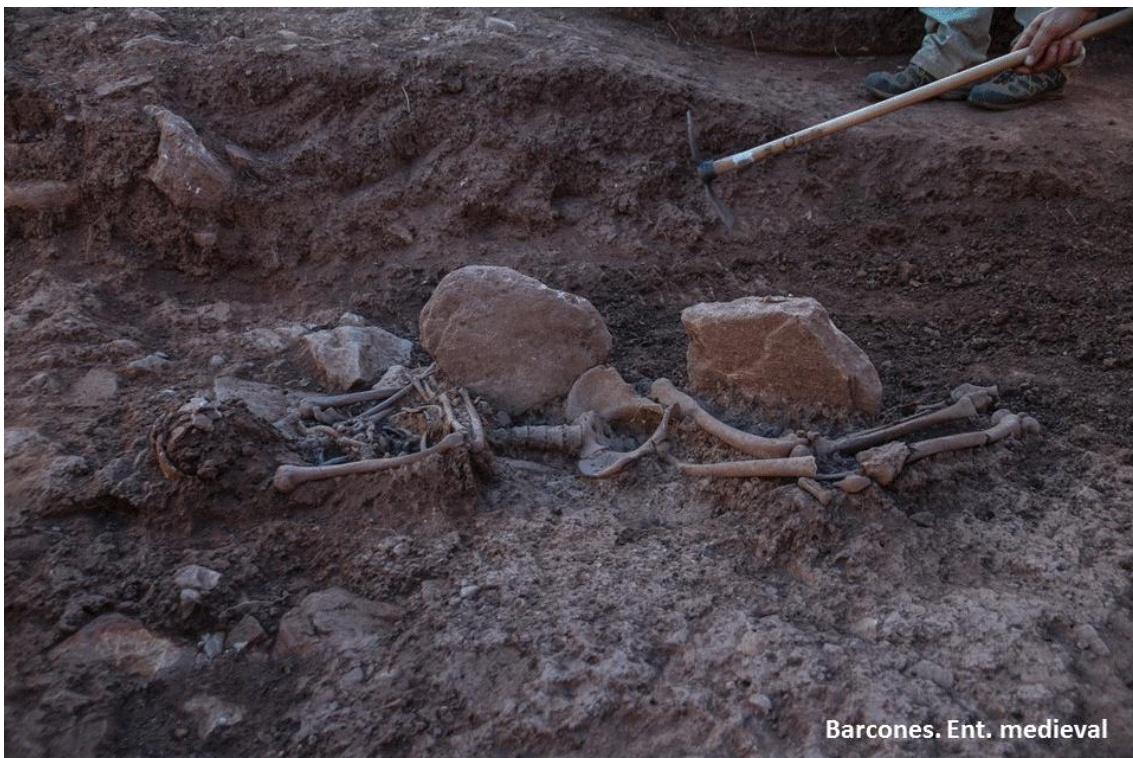
Esqueleto del individuo expuesto.