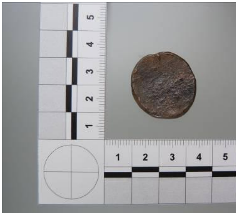
Disco metálico de plomo.