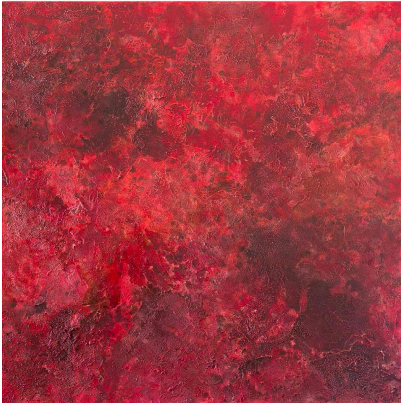
La tierra arde I

Presentará 3 obras de técnica mixta de 100 x 100 cm. cada una.