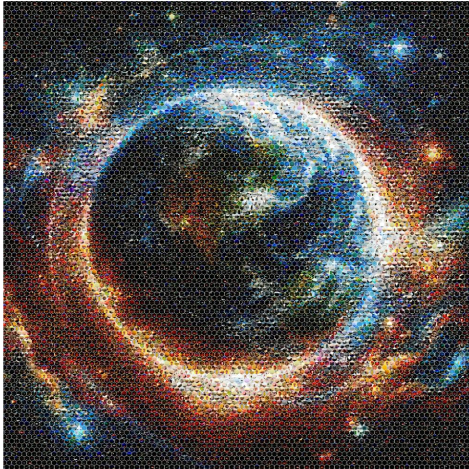
El despertar de Gaia

Presentamos una, la más grande de 200 x 200 cm. compuesta por 10.044 fotografías