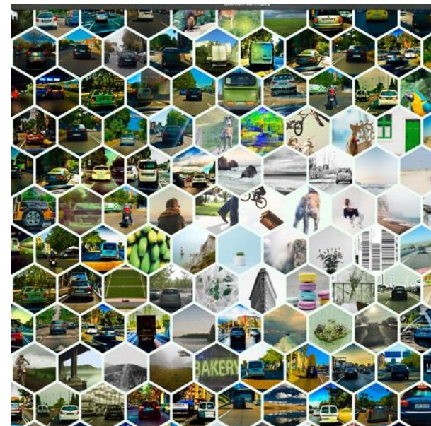
Detalle de la obra