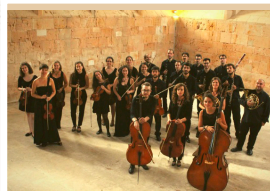
ENSEMBLE DURIUS Jueves 1 de agosto I.E.S Antonio Machado. 21:00 horas. 5 €