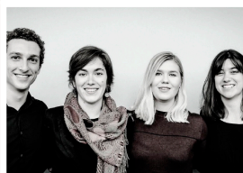
ADORNO QUARTET Jueves 15 de agosto Ruinas de San Nicolás. 20:30 horas. 5 €