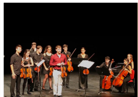
CAMERATA DESCLASIFICADA Domingo 4 de Agosto Alameda de Cervantes. 19:30 horas.