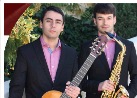
VERSALITIS DÚO. PRESENTACIÓN Martes 18 de julio I.E.S Antonio Machado. Salón Rojo. 20:30 horas