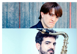
SORIA & MOLINA (dúo saxo y piano) Jueves 22 de agosto I.E.S Antonio Machado. 20:30 horas. 5 €