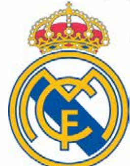
Real Madrid C.F.