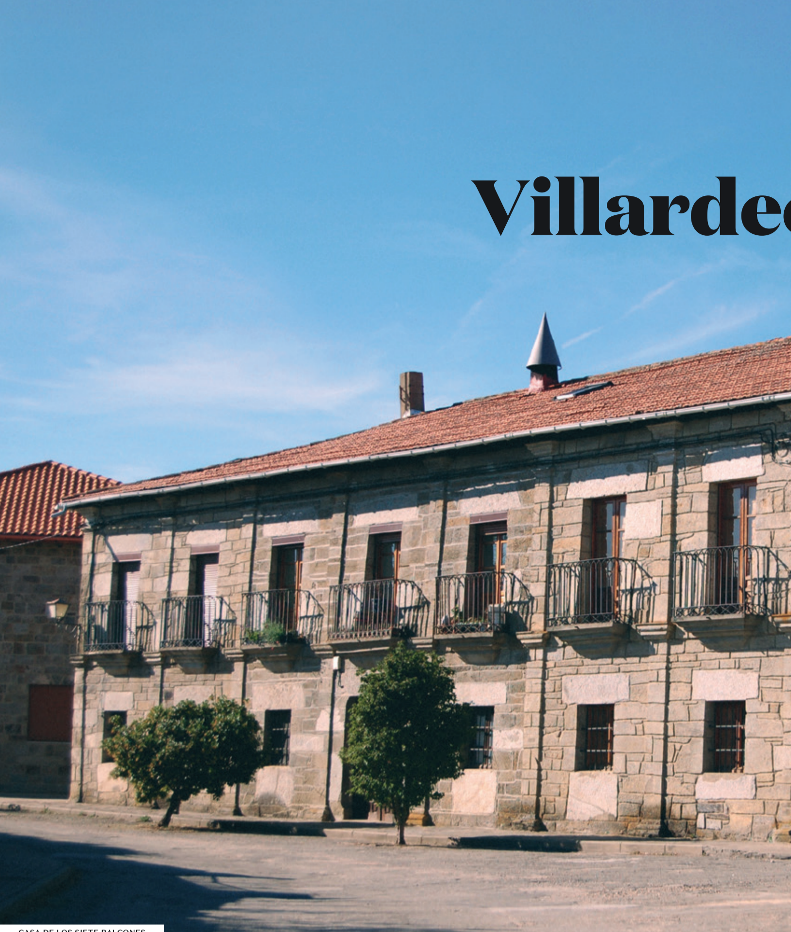
CASA DE LOS SIETE BALCONES

Villardecievros es un pueblo zamorano enclavado en la comarca de Sanabria y Carballada.