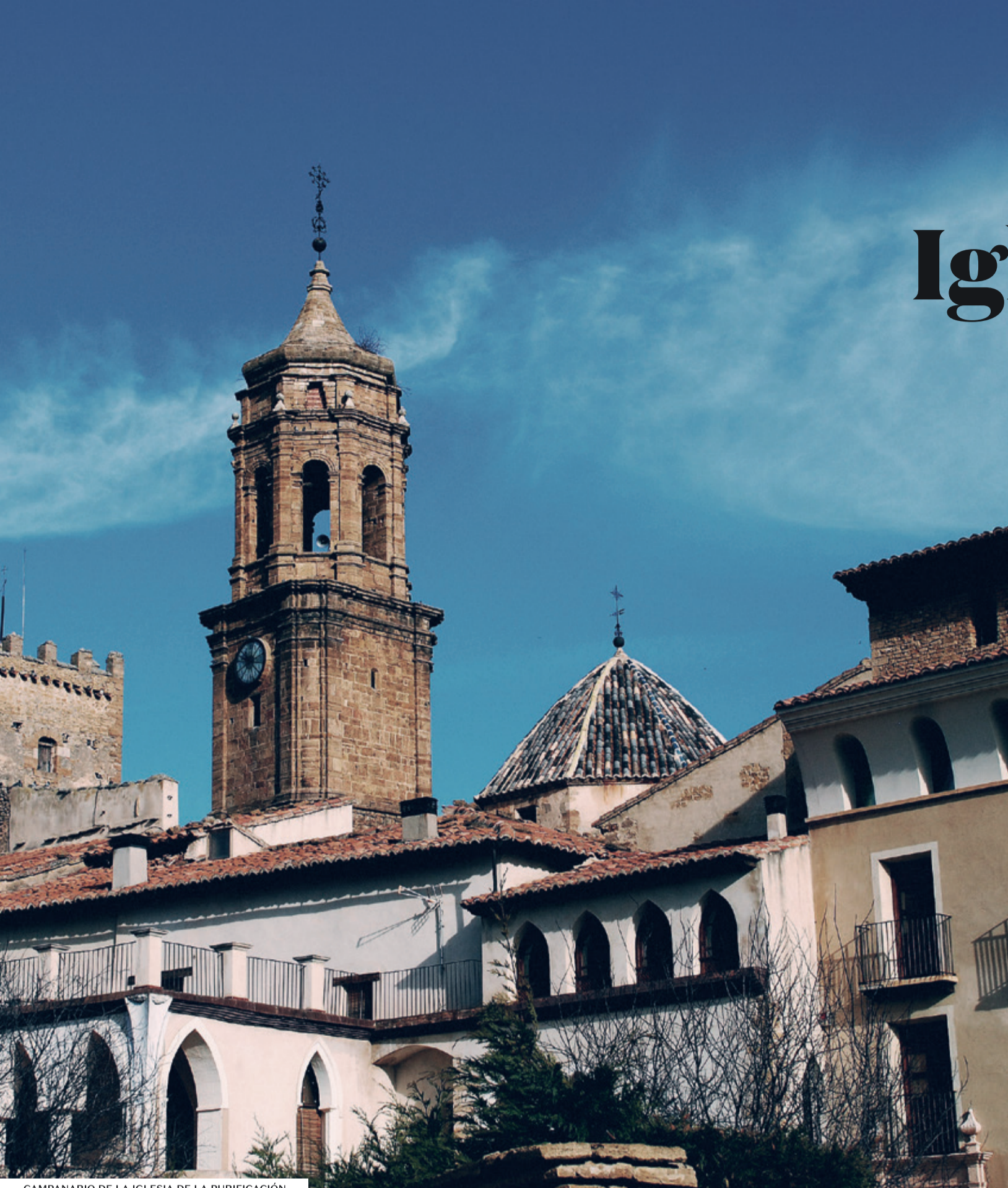
CAMPANARIO DE LA IGLESIA DE LA PURIFICACIÓN

Primera semana de septiembre: Fiestas Patronales en honor a la Virgen del Cid.