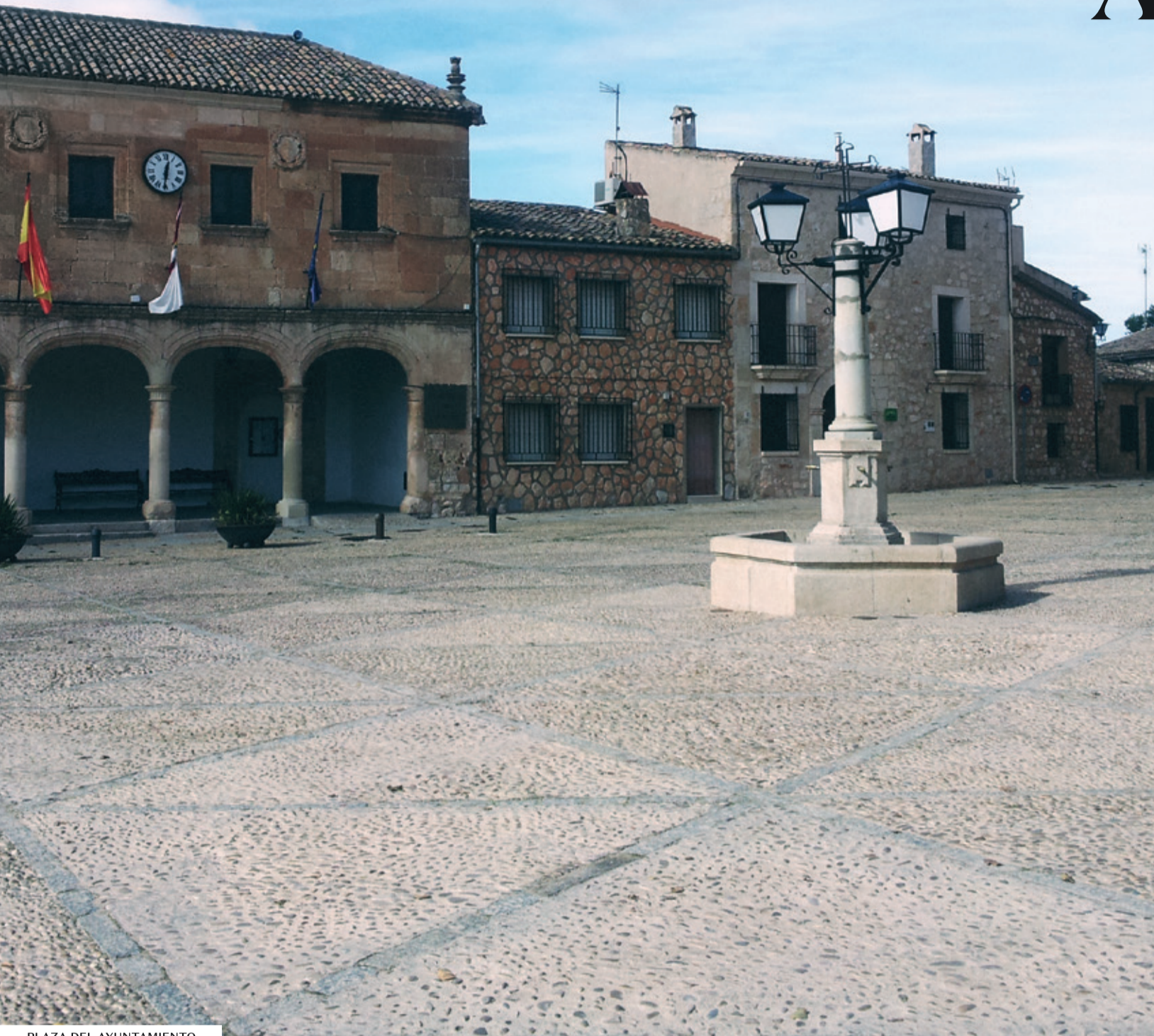
PLAZA DEL AYUNTAMIENTO

El municipio de Alarcón se encuentra encajado entre las gargantas del río Júcar a su paso por la provincia de Cuenca. Declarado Conjunto Histórico Artístico por la belleza de sus monumentos y su entorno, se alza como mirador y reserva natural donde los haya. Dentro de la villa se encuentra representado gran parte del arte español. El número de habitantes de Alarcón es de 153.