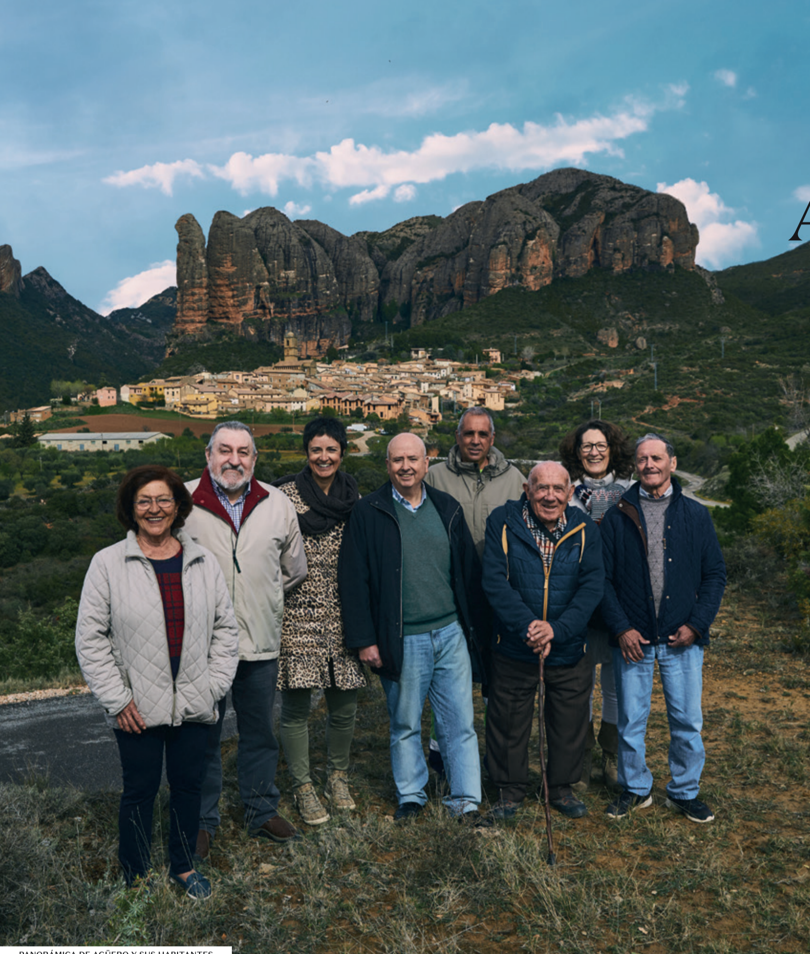
PANORÁMICA DE AGÜERO Y SUS HABITANTES

3 de febrero: San Blas. 16 de agosto: San Roque. Semana del Carnaval: Fiestas d'as Mascaretas.