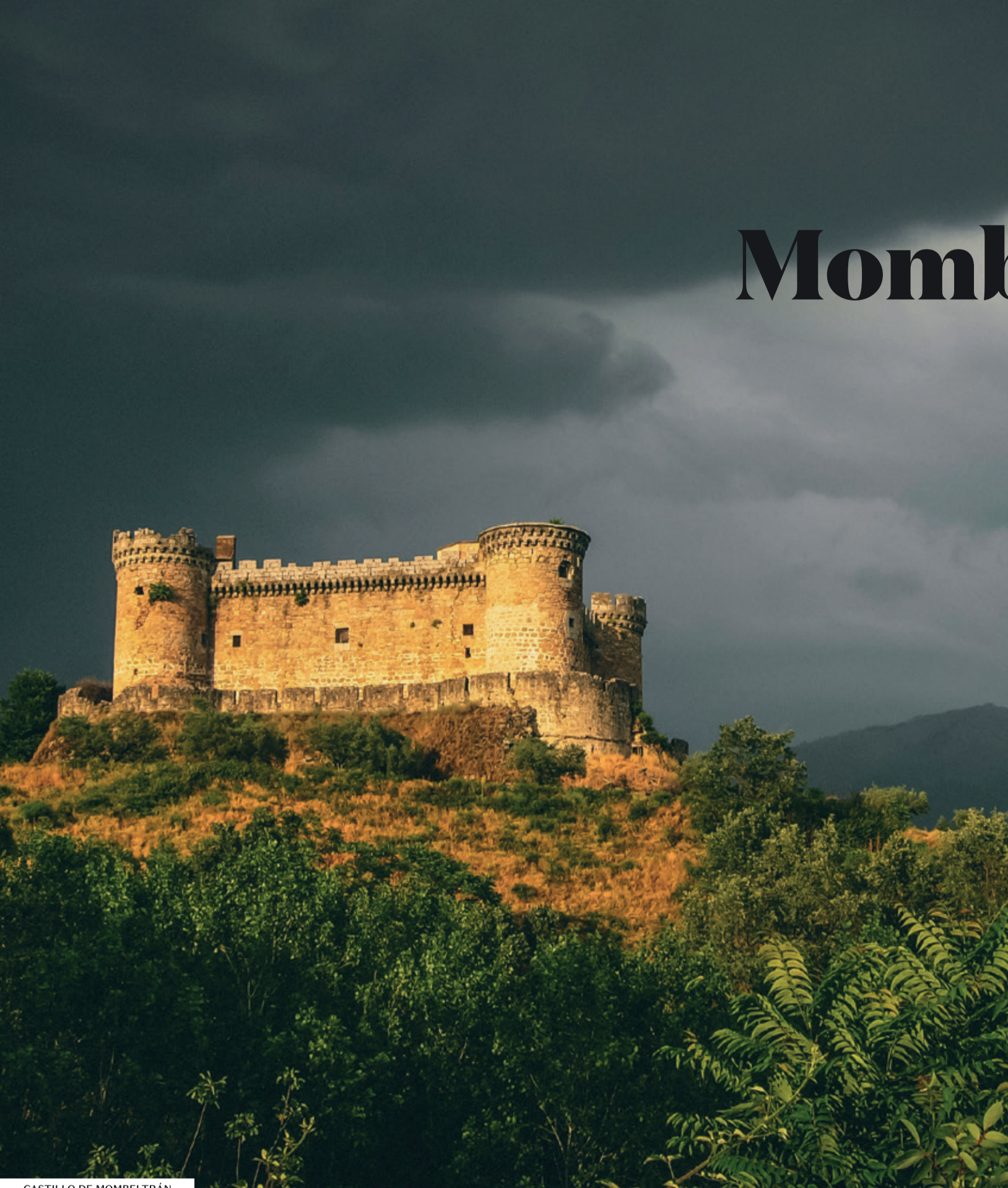
CASTILLO DE MOMBELTRÁN

2 de Julio: Fiestas patronales de Nuestra Señora de la Puebla. 16 de Agosto: Fiestas de San Roque. Durante 5 días se celebran charangas, encierros, concursos. gastronómicos, comidas populares y actividades deportivas.