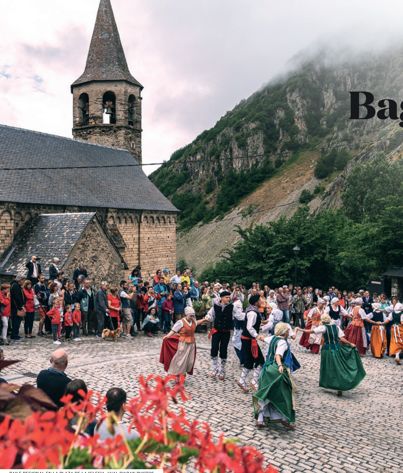
BAILE REGIONAL EN LA PLAZA DE LA IGLESIA, ©VAL D'ARAN PHOTOS