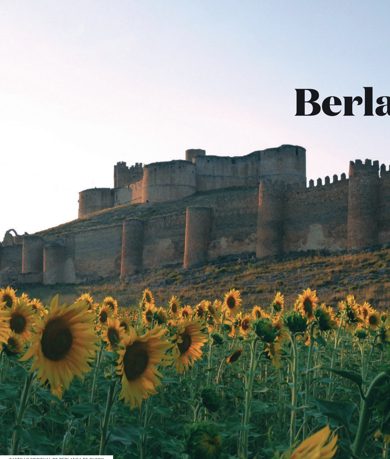
CASTILLO MEDIEVAL DE BERLANGA DE DUERO

Las primeras noticias documentales sobre Berlanga de Duero datan de la Edad Media, en cuyo momento la población y su castillo formaban parte del sistema defensivo del Califato en la frontera de la Marca Media.