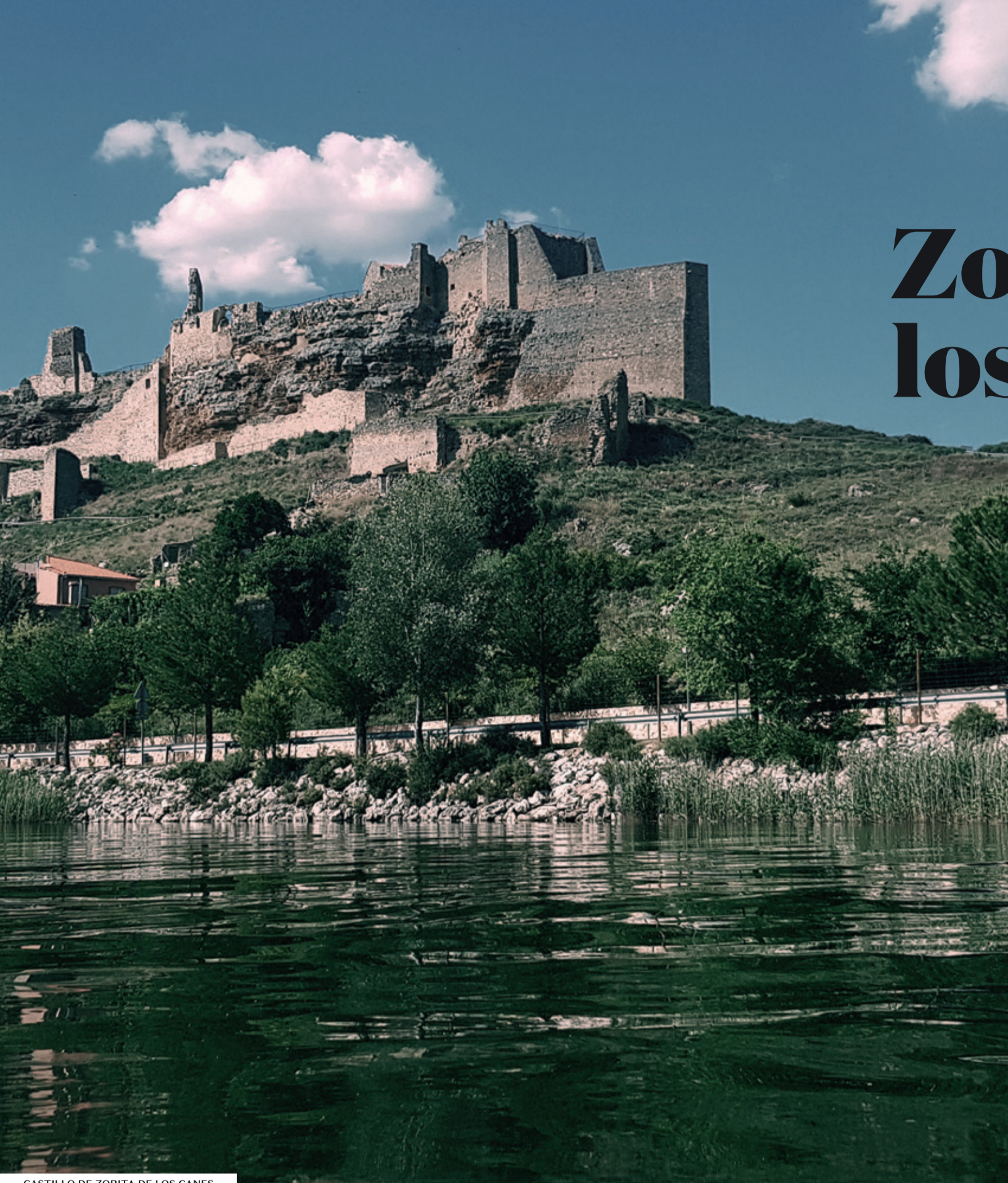
CASTILLO DE ZORITA DE LOS CANES