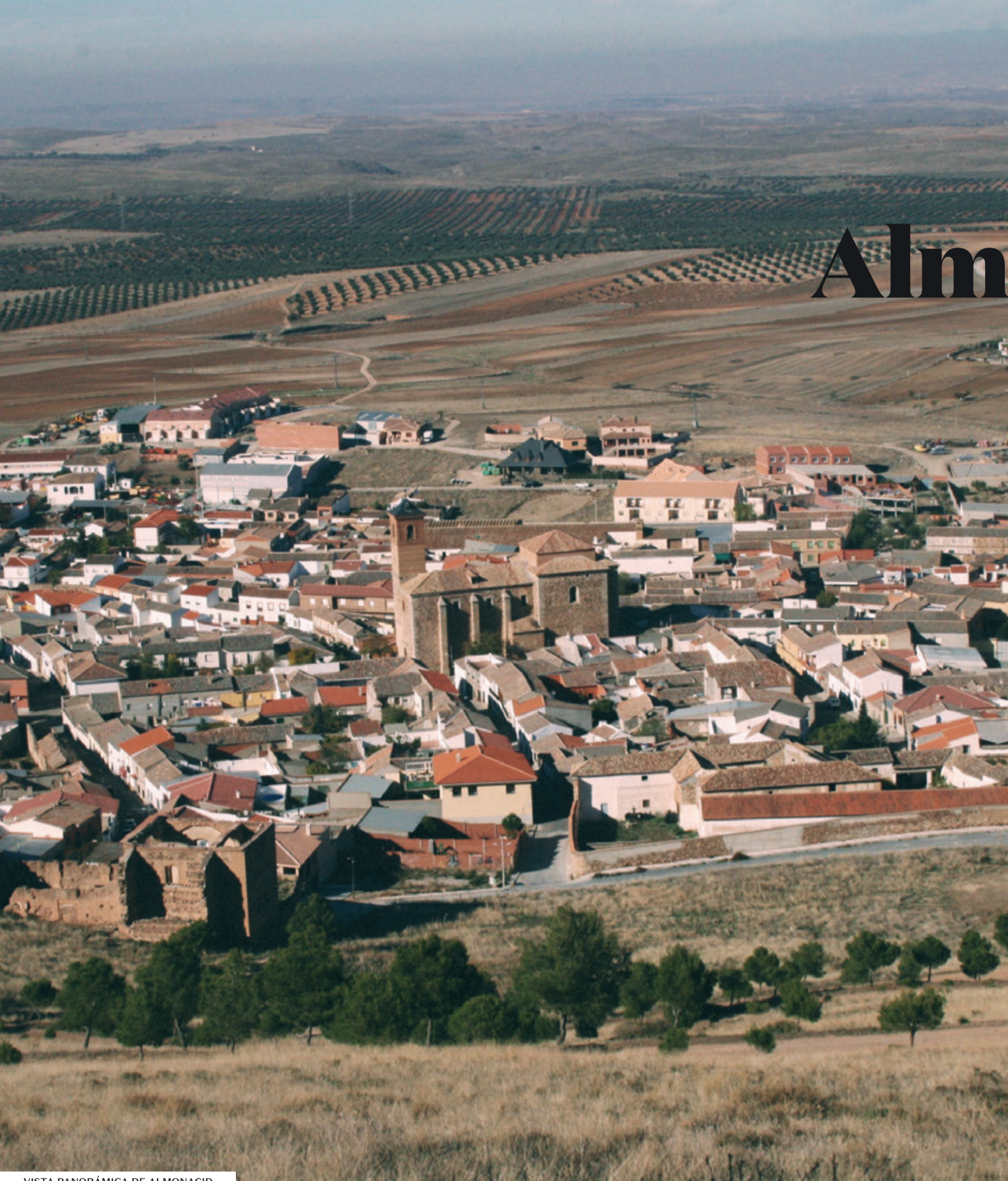
VISTA PANORÁMICA DE ALMONACID