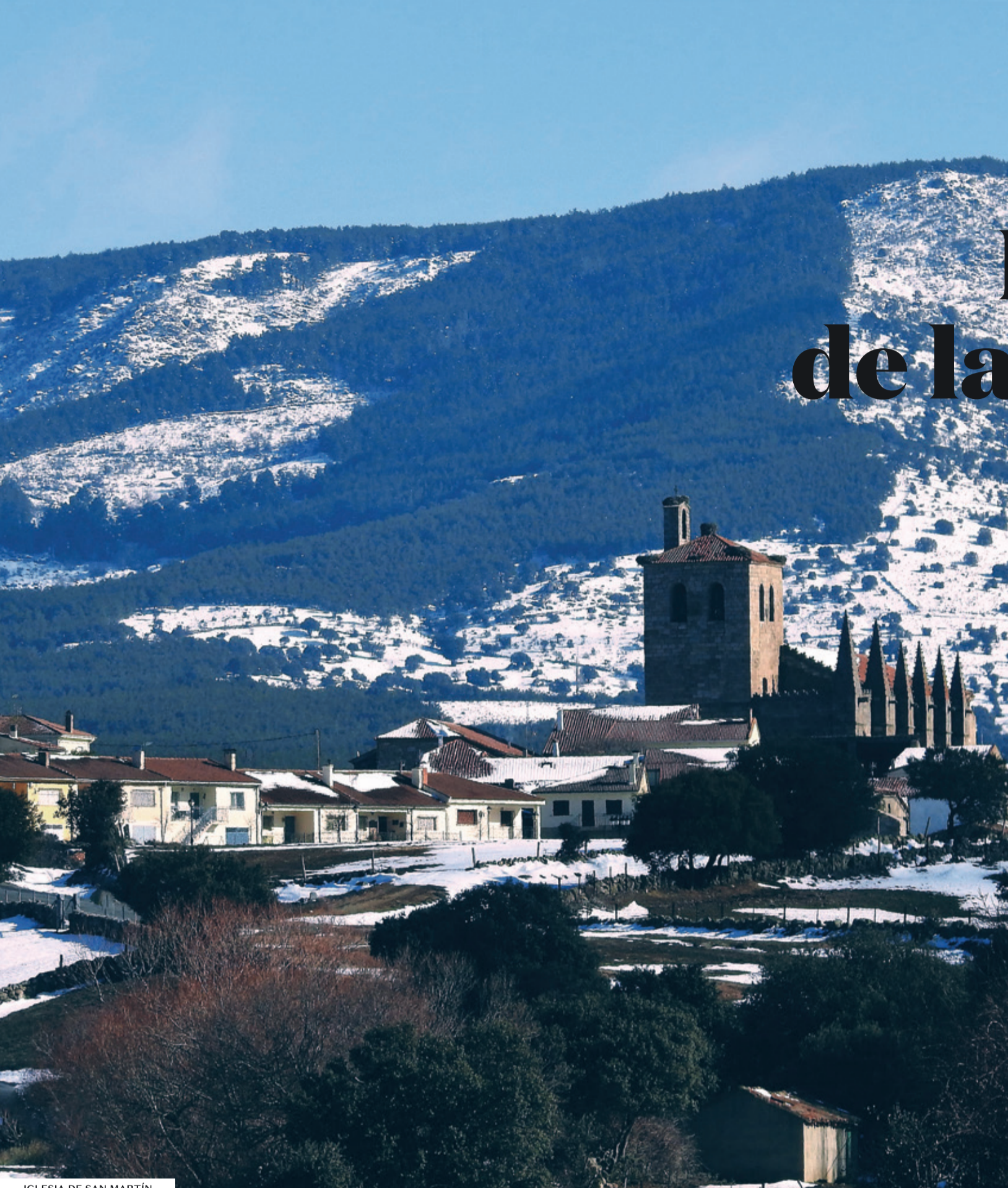
IGLESIA DE SAN MARTÍN

Bonilla de la Sierra es un pueblo medieval ubicado en la provincia de Ávila. Elegido como uno de los pueblos mas bonitos de España y nombrado Conjunto Histórico Artístico en 1983. Tras ser donado por la corona al obispo abulense Domingo Blasco, en el siglo XIII, se convirtió en señorío del episcopado abulense en 1224, y en residencia veraniega de los mismos hasta el siglo XVIII. Actualmente residen en el pueblo 120 personas.