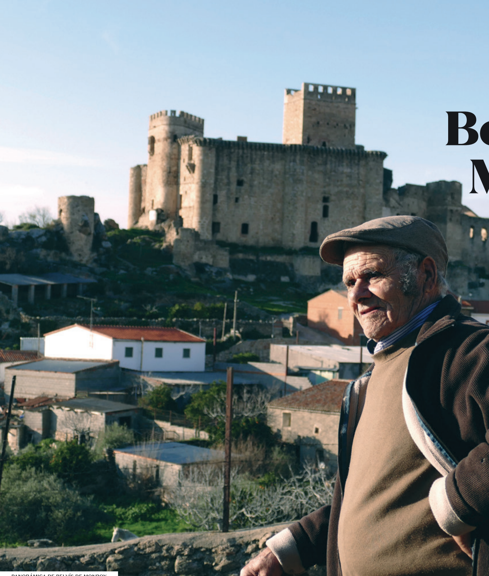
PANORÁMICA DE BELVÍS DE MONROY

Junio: La Romería de la virgen del Berrocal Primer fin de semana de Agosto: Fiestas de Nuestra Señora del Rosario. 19, 20 y 21 de Agosto: Fiestas de San Bernardo.