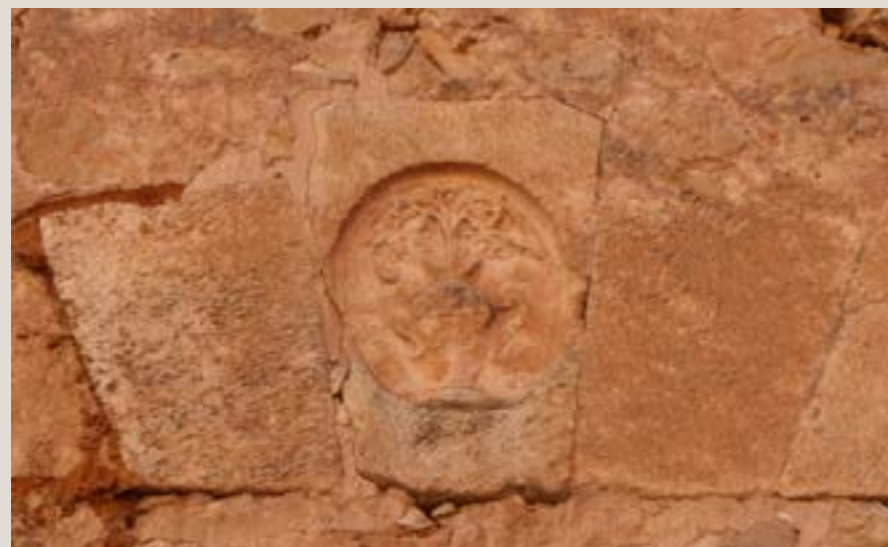
Jarrón con azucenas, escudo de armas de la catedral de Osma

El nevero tenía que devolver los pesos y demás instrumentos al fin del arrendamiento "en la misma disposición que lo recibe y con el mismo peso y calibre que se le ha entregado" , se comprometió a pagar 600 rs., a finales de diciembre de cada año.