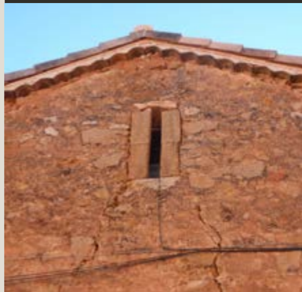
Edificio del pozo de nieve, propio del cabildo oxomense hasta la desamortización

Villa del Burgo en quinientos reales vellón que en cada un año paga a dicho Cabildo”.