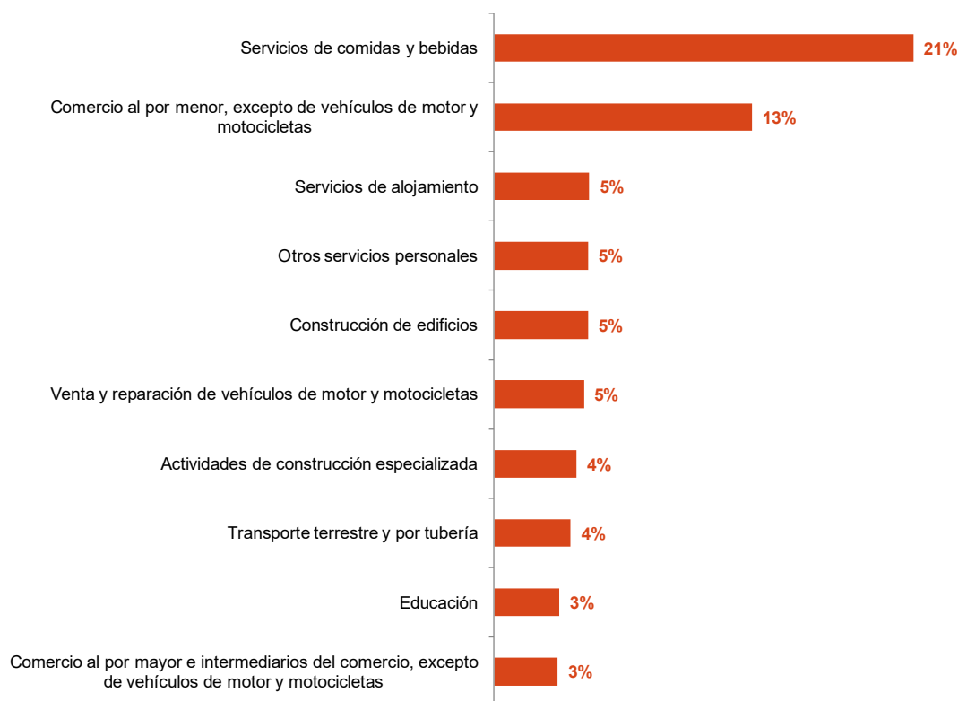
Gráfico 2. Distribución de los 10 sectores solicitantes de ERTE con mayor peso en Soria, a 31 de octubre de 2020 (% de solicitudes / total de ERTE tramitados)

En este sentido, el “Plan de choque” contempla ayudas al sector de la hostelería para fomentar la actividad a través de la adecuación de espacios seguros para los clientes, mediante cerramientos de terrazas y mobiliario como estufas, cortavientos y mamparas (5 millones), así como ayudas al sector turístico para la reactivación de la demanda (2 millones).