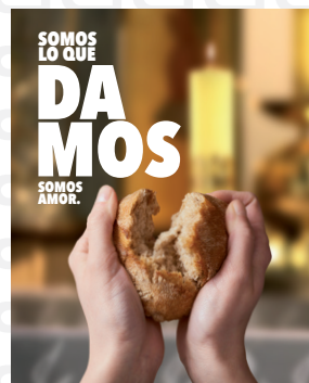
DÍA DE CARIDAD 2022