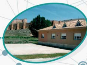
Ntra. Sra. del Mercado Berlanga de Duero Soria