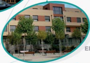
Benilde El Burgo de Osma Soria