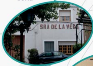
Ntra. Sra. de la Vega Serón de Nágima Soria