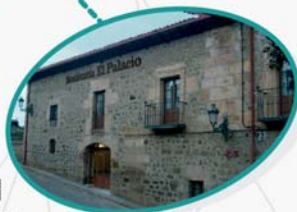
El Palacio Vinuesa Soria