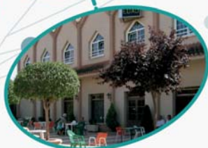
Ntra. Sra. de la Piedad Quintanar de la Orden Toledo