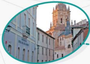
Ntra. Sra. del Carmen El Burgo de Osma Soria