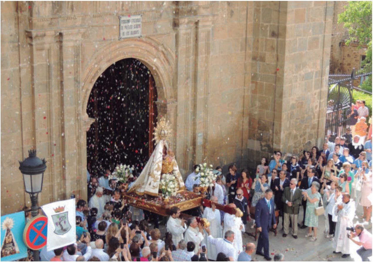
Fotografía: Milagros Molero