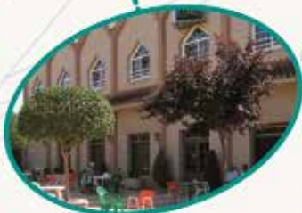
Ntra. Sra. de la Piedad Quintanar de la Orden Toledo