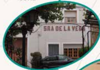
Ntra. Sra. de la Vega Serón de Nágima Soria