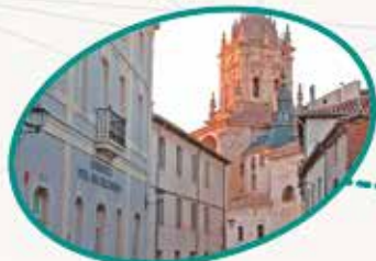
Ntra. Sra. del Carmen El Burgo de Osma Soria