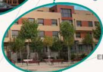
Benilde El Burgo de Osma Soria