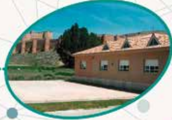
Ntra. Sra. del Mercado Berlanga de Duero Soria