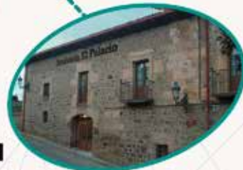
El Palacio Vínuesa Soria