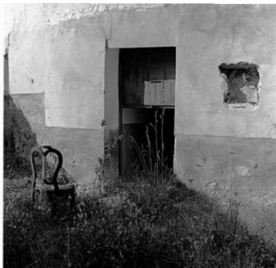
Exposición Caloto. Soria en esencia