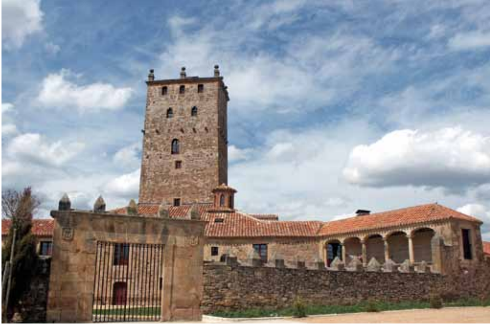
Casa Fuerte de Aldealseñor.

RENIEBLAS Nuestra Señora de la Cruz, Iglesia gótica con elementos románicos, con cementerio medieval a su alrededor, como lo denotan las estelas que sobresalen. Restos de dos palacios, uno de ellos blasonado. Restos arqueológicos importantes, por hallarse muy próxima a Numancia, campamentos romanos. Monumento dedicado al descubridor de estos yacimientos, Schulten. ALMAJANO Iglesia de San Andrés, originalmente gótica del XVI conserva de aquella época tres tramos de la nave cubiertos con bóveda de crucería. Ermita de la Soledad. Casa fuerte de los Salcedo en la plaza Mayor, s. XVI. Varias casas blasonadas de piedra s. XVIII. SUELLACABRAS Iglesia gótica del Salvador. Ermita de la Virgen de la Blanca, y ruinas de San Capracio. Fue lugar de trashumancia y ubicación de mesteños, como lo demuestran sus casas blasonadas. Ruinas de importante casa de esquilero, con arcos, datada en 1768. Despoblado de San Román (en El Espino) y San Martín. Tradicionalmente, y debido a las ruinas allí existentes, ubican la Ciudad del Río Alhama junto al nacimiento de este río. La villa fue señorío de la Casa de Alba. Paraje conocido con el nombre