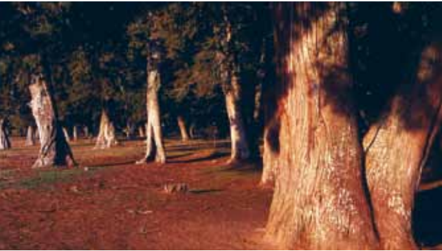
Sabinar de Calatañazor.

tran ammonites, belemnites, braquiópodos, bivalvos, crinoideos y demás fauna marina que pobló estas tierras cuando estaban cubiertas por agua, hace 200 millones de años. Cuenta con un pequeño museo etnográfico. VADILLO se caracteriza por una arquitectura bien conservada. Entre su patrimonio destaca la Iglesia de la Natividad de Nuestra Señora, situada a las afueras del pueblo sobre una loma, que fue construida a mediados del siglo XVII. Templo de grandes dimensiones que consta de tres naves con crucero, retablo barroco, pila bautismal románica y un órgano del siglo XVIII. CASAREJOS típico pueblo pinariño, con arquitectura en mampostería de cierto interés. Se conservan casas con chimeneas cónicas y entramado de adobe y madera. Balcones de madera bien labrada. Por su término discurren los ríos Lobos y Navaleno. Cabe destacar el Paraje natural de "La Laguna,