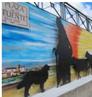
Plaza de la fuente. Almarail

Partimos de VALDESPINA pueblo rodeado de encinas, de calles y jardines bien conservados. Nos disponemos a caminar río arriba, siguiendo el GR-14 "SENDA DEL DUERO" en dirección hacia Ituerro y Tardajos de Duero. Nada más abandonar Valdespina, cruzamos el puente del Canal de Almazán y a la izquierda nos encontramos la presa del antiguo Molino de La Solana (siglo XVII), ubicado en la margen contraria del río, en un paraje de belleza singular. Seguimos por el GR-14 caminando con el Duero a nuestra izquierda, Cruzamos otro puente que salva el canal y nos adentramos en el término de ALMARAIL . Seguimos caminando en paralelo al canal por el GR-14 y a aproximadamente 800 m. tomamos un desvío hacia la derecha que nos llevará hasta una antigua taina en el paraje conocido como "Majadilla". En este momento, nos aventuramos por la ladera del monte hacia arriba, hasta llegar a la ATALAYA TORRE-