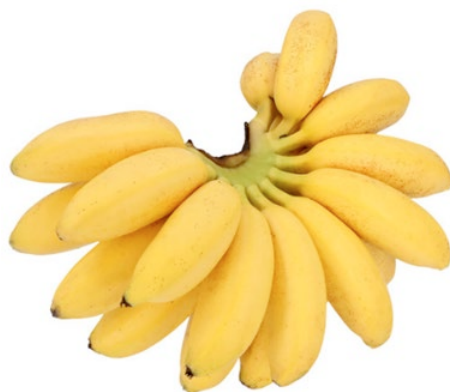
Figura 4. Plátano “dominico”

Fue también Fray Tomás el primer español que comenzó a plantar el tomate de forma intensiva. Además, fue el responsable de la agricultura organizada en el Nuevo Mundo, gracias a él se trasladaron las técnicas agrícolas de nuestro país a Centroamérica, y a él también debemos la introducción en el Viejo Continente no sólo del tomate, sino también la patata y el perejil. Por todas estas innovaciones dietéticas y gastronómicas Fray Tomás de Berlanga es considerado por muchos el patrón de la Dieta Mediterránea. Esta dieta, incorporada a nuestro lenguaje cotidiano, fue declarada, a mediados del año 2010, Patrimonio Cultural Inmaterial de la Humanidad, en denominación conjunta para España, Grecia, Italia y Marruecos (7,8) .