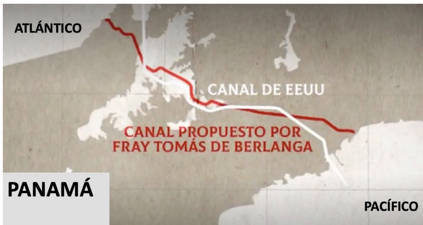
Figura 3. Proyecto de Fray Tomás y canal de Estados Unidos

Este fue el primer estudio realizado para la construcción de un canal que permitiera a los buques cruzar de un océano al otro por Panamá, y su curso seguía más o menos el del actual Canal de Panamá. Para cuando se terminó el levantamiento del mapa, el gobernador opinó que sería imposible para cualquiera lograr tal hazaña. Su idea se materializaría siglos más tarde con la obra de canalización del Chagres, y el consiguiente Canal de Panamá.