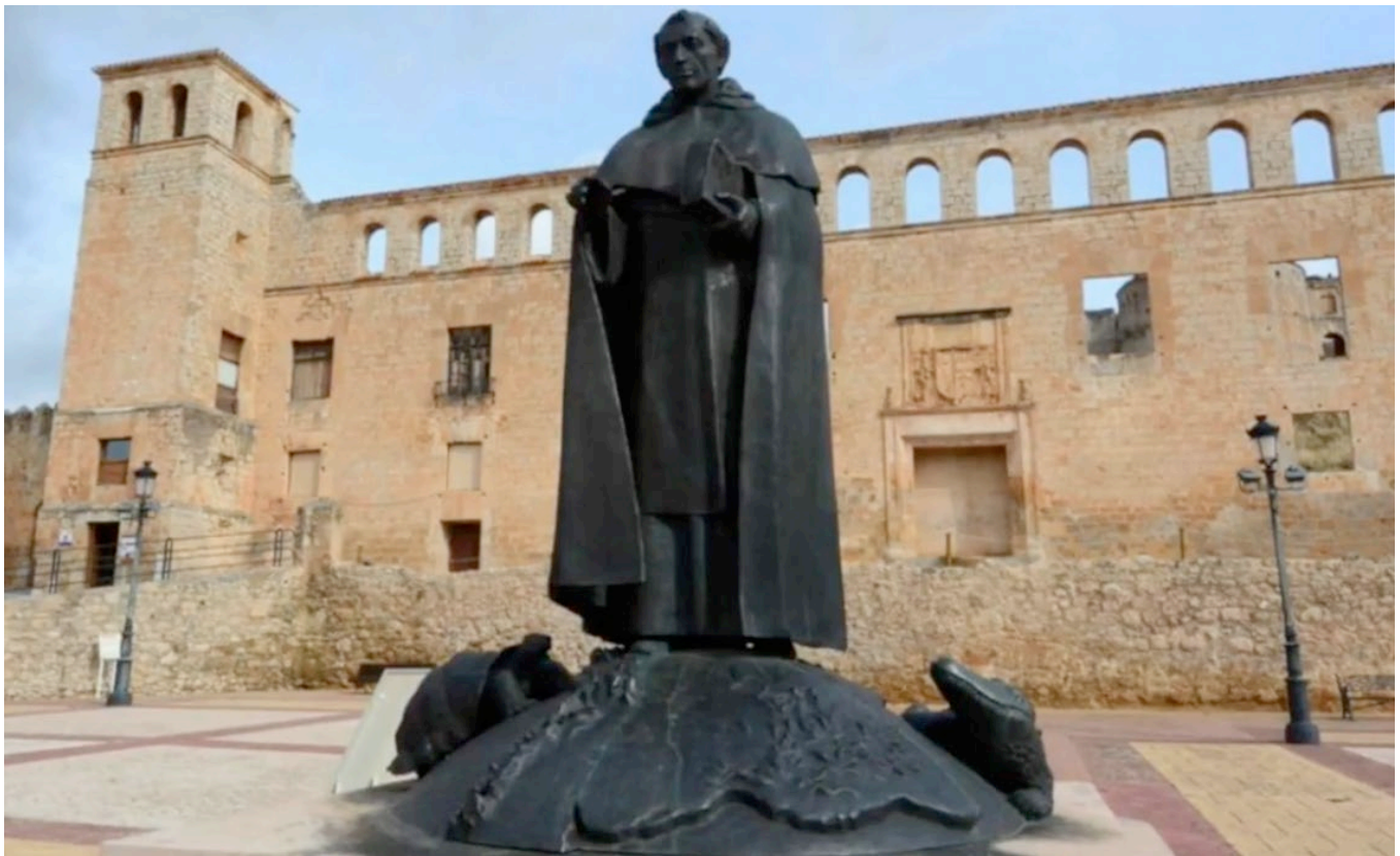
Figura 5. Fray Tomas. Al pie el recuerdo de Las Galápagos y “el Lagarto”

“Lagarto de Fray Tomás”. Se trata un caimán negro, disecado, que trajo de Panamá fray Tomás de Berlanga en 1543 y que ofreció a la colegiata de su pueblo natal. Había regresado tras una vida culminada como tercer obispo de Panamá, consejero de Carlos V, inquieto viajero y curiosa persona creativa. Hoy, el pueblo natal de fray Tomás no llega a 1.000 habitantes y casi nadie recuerda su nombre. Eso sí, pueden alojarse en el Hotel Fray Tomás. También, como curiosidad, el libro de José Javier Esparza, “Almanaque de la Historia de España”, menciona como Efemérides del 23 de febrero: 1535: Fray Tomás de Berlanga, obispo de Panamá, descubre las islas Galápagos (10) .