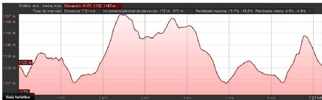
Perfil longitudinal carrera 7k

En cuanto al perfil de la prueba no se caracteriza por ser demasiado exigente. Se parte desde los 1122 metros dentro del casco urbano para luego ascender a los 1167 metros en el punto más alto. En cualquier caso, las pendientes en su mayoría son tendidas y no comportan riesgo alguno.