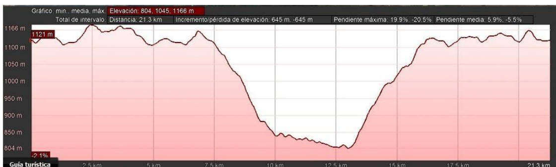
Perfil longitudinal media maratón

hasta las inmediaciones de Valdelagua del Cerro a unos 1160 m. para completar el recorrido alrededor de la localidad de Valdelagua del Cerro.