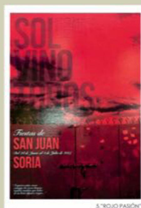
5. "ROJO PASIÓN"