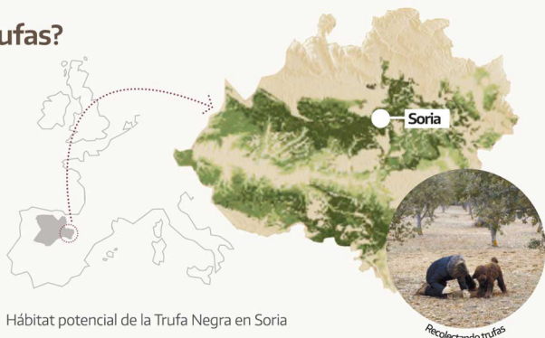
Hábitat potencial de la Trufa Negra en Soria

La provincia de Soria atesora uno de los productos forestales más singulares y apreciados del mundo: las trufas, verdaderos diamantes negros del bosque muy valorados en la cocina para la aromatización de platos y productos agroalimentarios.