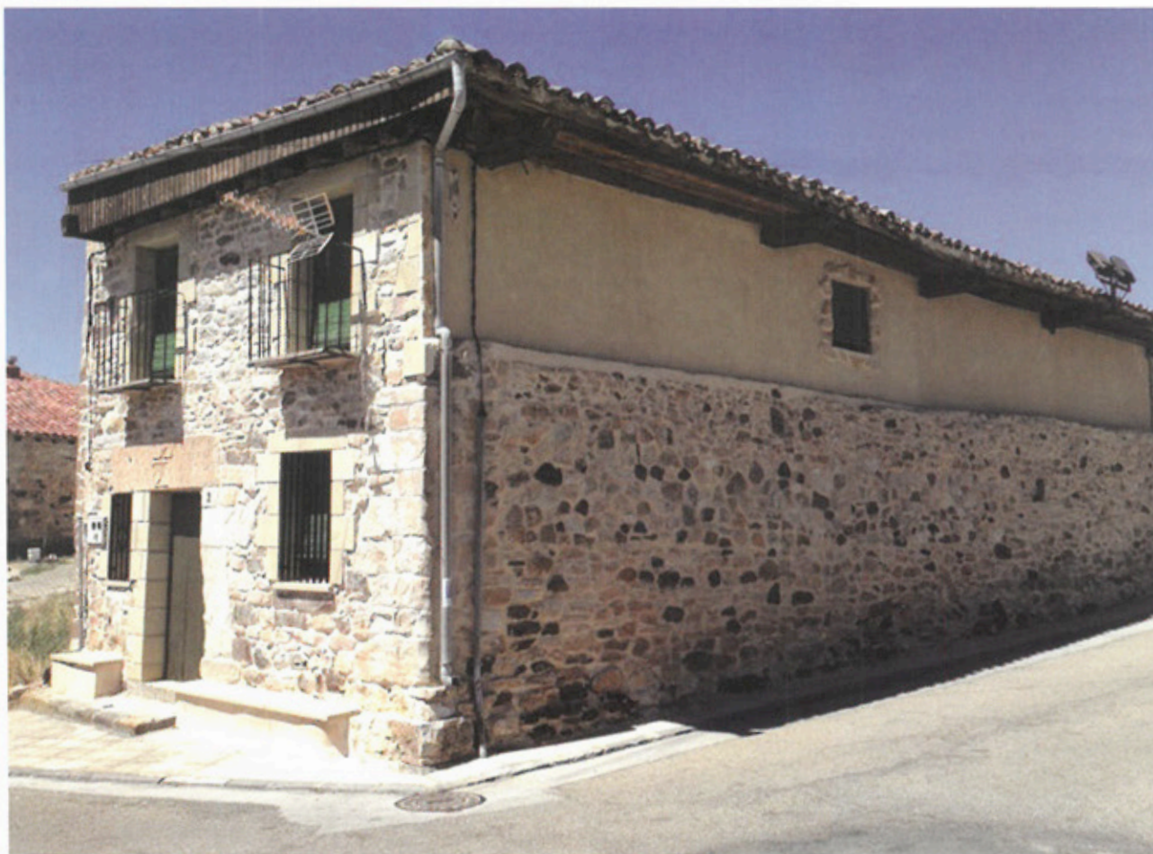
Edificio del hospital San Sebastián y detalle del dintel de la puerta