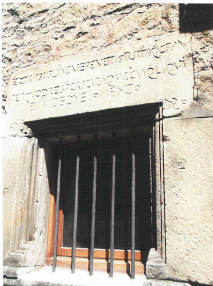
Ventana hospital de Covaleda

Hospital”, no porque hubiese sido un hospital, más bien es por el sentido de que había un lugar que ofrecía hospedaje.