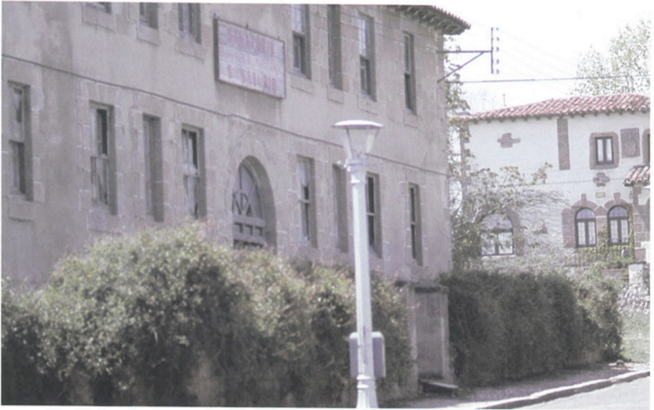
Edificio antiguo Sanatorio San Saturio