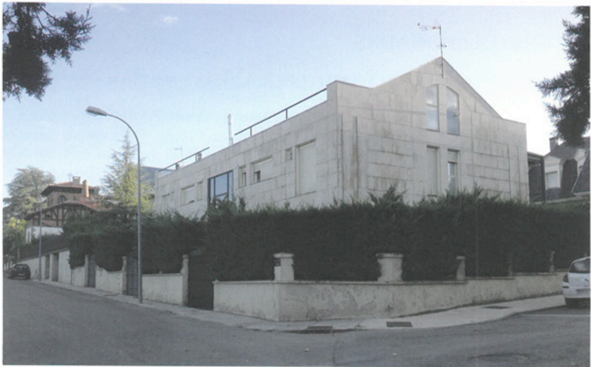
Solar de la antigua Clínica Mazariegos