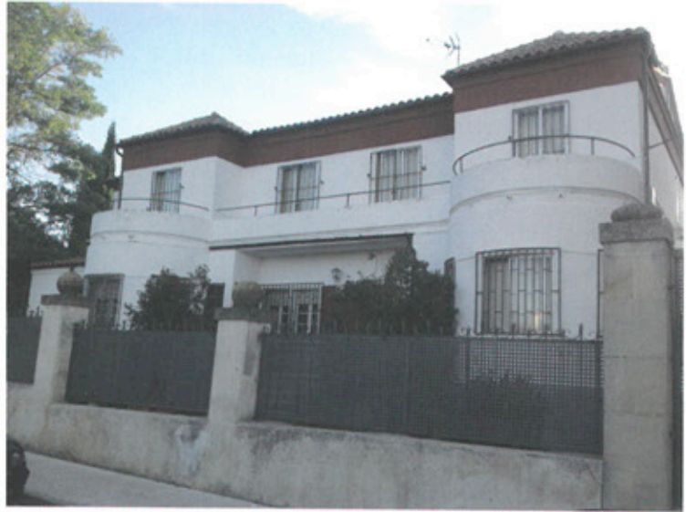
Distintas fotografías del Sanatorio del Pilar