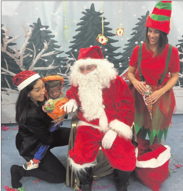
EL C.I. Gloria Fuertes daba comienzo a la Navidad con la interpretación de un original belén representado por los alumnos de dos años. No faltó detalle, desde elfos o renos hasta pastores con ovejas y, cómo no, Papá Noel.