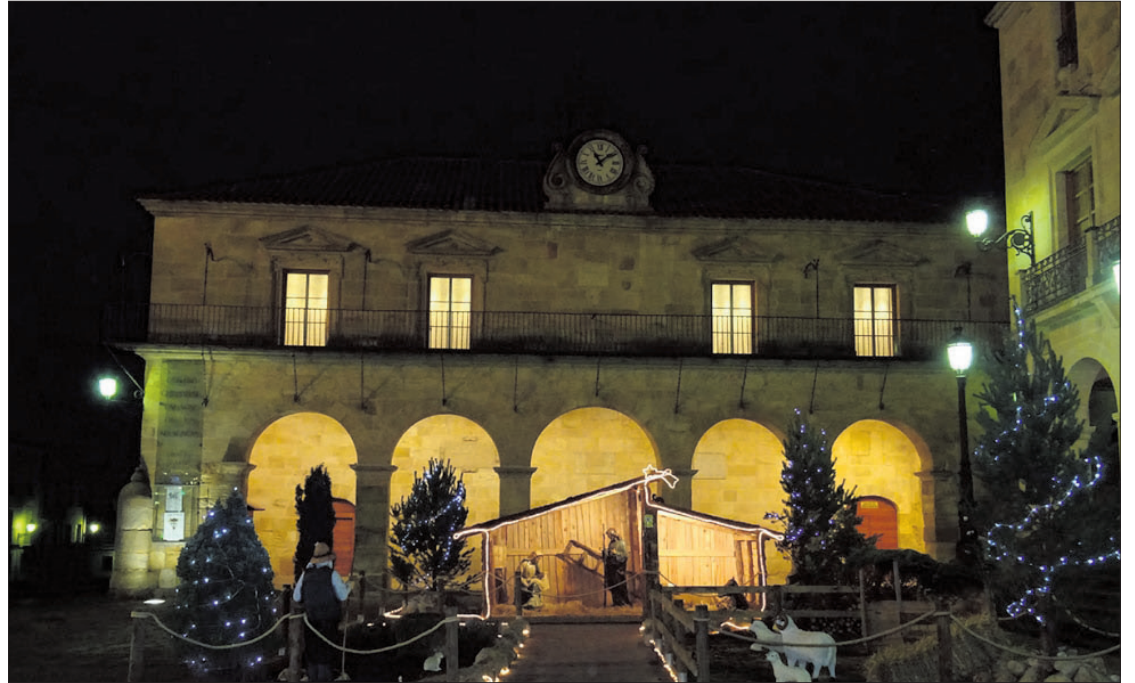
El Ayuntamiento de Soria no ha querido faltar a las fechas navideñas y ha adornado cada rincón de la ciudad. El belén y el árbol de la Plaza Mayor, las luces por todas las calles, los adornos reciclados para contribuir a un mundo sostenible... En la imagen el belén de la con el Palacio de la Audiencia al fondo como la imagen más representativa de la Navidad en la capital.

empeñan en vestir las calles con luces de colores y adornos que hacen estas fechas un poco más especiales. Por eso, desde Soria Noticias, hemos querido reflejar en estas páginas algo de esa decoración tan propia de las fiestas que nos alegra al salir a dar un paseo o volver a casa de trabajar. Se incluyen los deportes que han sido 'más navideños' para traer a este reportaje fotográfico una representación total de la sociedad y demostrar que todo tiene cabida en Navidad.