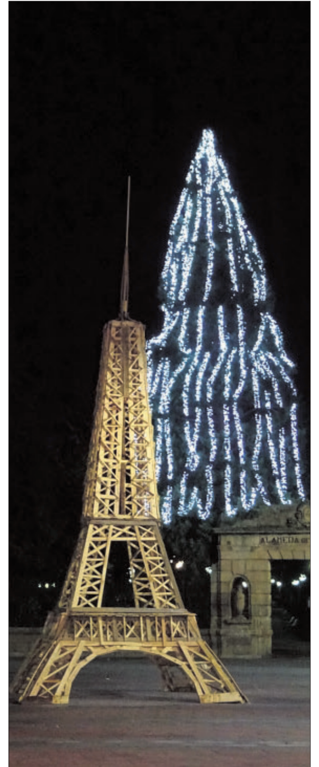
La Dehesa y la plaza Mariano Granados, como corazón de la capital, no andan escasas de decoración navideña, incluyendo la entrada al Parking y la Torre Eiffel instalada con motivo del Certamen Internacional de Cortos y que no sabemos si ha llegado para quedarse. SN