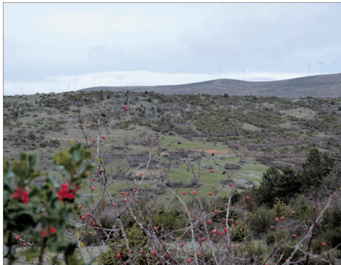
Imagen del paisaje desde el bosque de acebos de la zona.