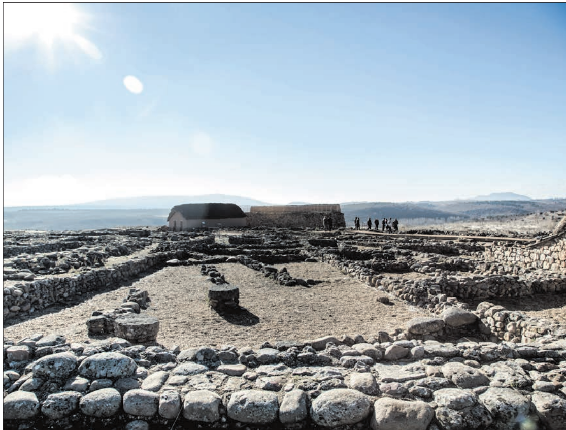
Imagen del yacimiento de Numancia, en la localidad de Garray.