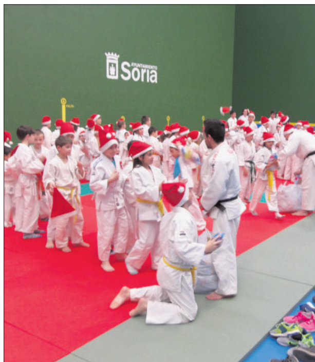
La Delegación Soriana de Judo quiso celebrar la Navidad de este modo, poniendo gorros de Papá Noel a todos los niños en su concentración. Así, lograron una imagen de lo más vistosa con los 'mini Papá Noeles en formación sobre el tapete rojo'