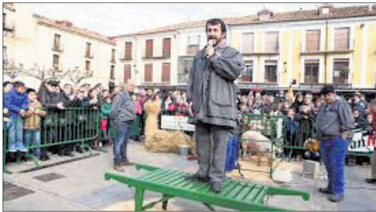
Las matanzas previas a la degustación.