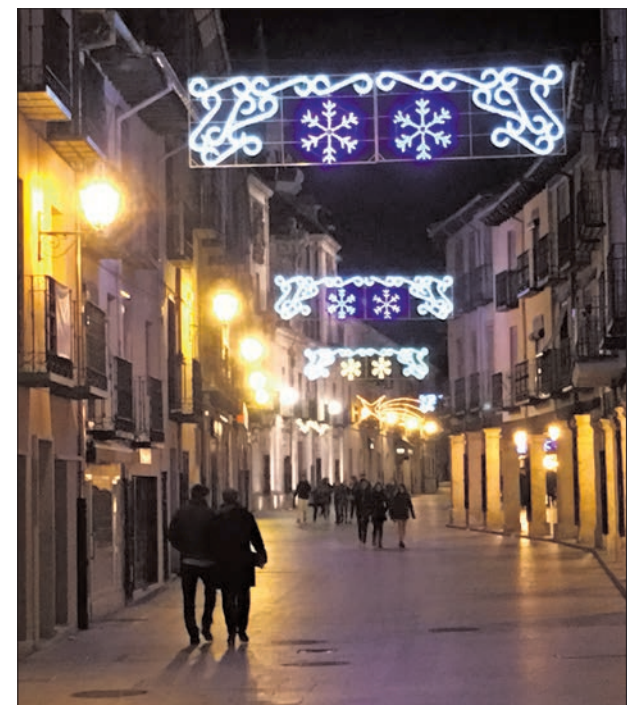
El Burgo de Osma tampoco ha querido faltar a la iluminación de sus calles en Navidad. No les falta detalle con sus luces en representación de una nieve que casi no ha hecho aparición y las estrellas fugaces, dos de los motivos más navideños.