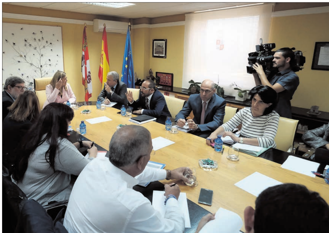
Reunión de la junta con los agentes sorianos para la elaboración del Plan de Dinamización.

Por eso, las nuevas tecnologías -entre ellas internet y las redes- es un tren que Soria no puede perder. Está a tiempo de cogerlo, y este nuevo plan es una buena ocasión por colocar a Soria a la vanguardia de estos servicios, necesarios para afrontar cualquier iniciativa industrial alternativa o de investigación.