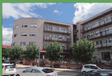
SORIA Residencia Fuente del Rey

asistencia - detalles - servicios trato familiar - intimidad - actividad atención - comodidad a tu servicio