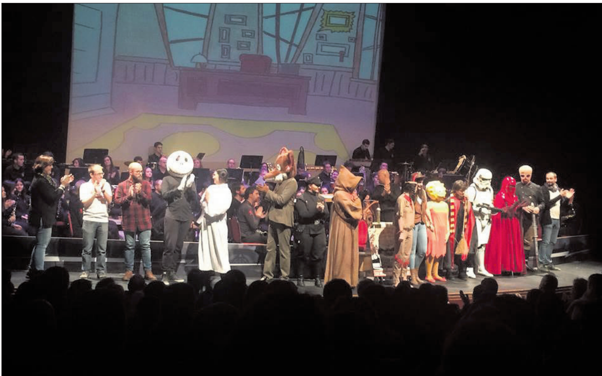
Como no podía ser de otra manera, el Concierto de Navidad que presentan la Banda Municipal de Soria y Cruz Roja titulado este año 'La música te lleva de viaje' fue un rotundo éxito. Tuvo lugar el pasado 23 de diciembre y los asistentes pudieron disfrutar de un recital de música acompañado por personajes disfrazados que hicieron las delicias de grandes y pequeños en el Palacio de la Audiencia. Para la representación contaron con la Legión 501 y numerosos personajes infantiles que animaron el espectáculo. CRUZ ROJA SORIA