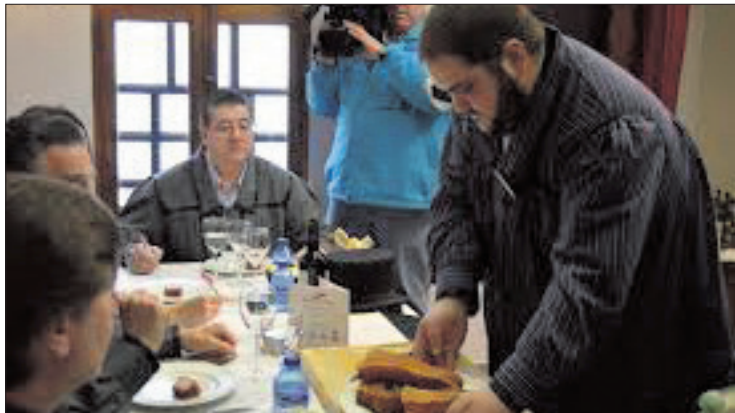
Momento de las matanzas de 2016.