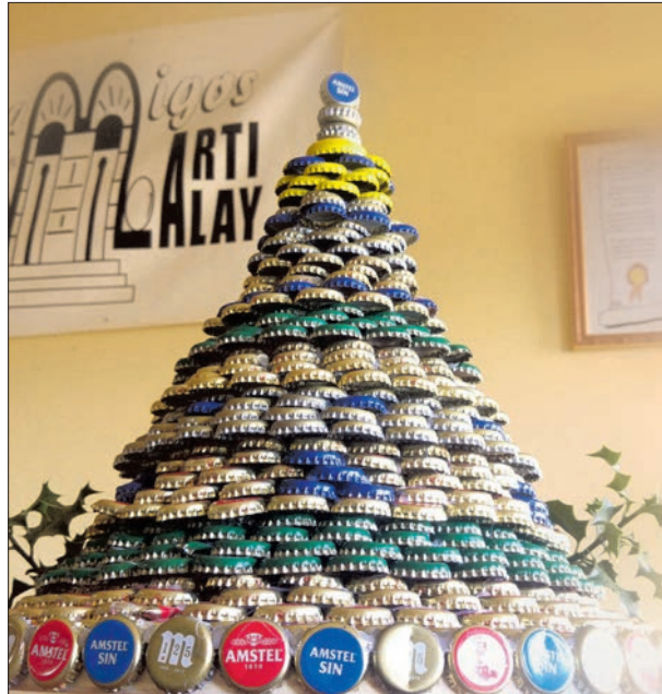
La Asociación de Amigos de Martialay ha celebrado la Navidad fabricando el árbol más original. Se han utilizado 2964 chapas que, pegadas una a una han acabado formando este árbol. Una forma muy navideña de reciclar.