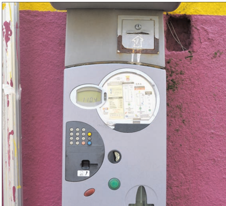
Imagen de uno de los parquímetros de la zona azul de la capital.