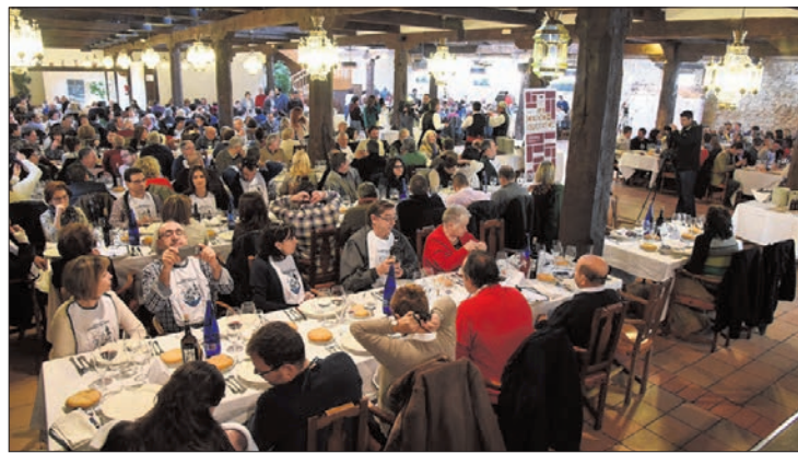
Salón Virrey-Palafox durante las jornadas 2016.