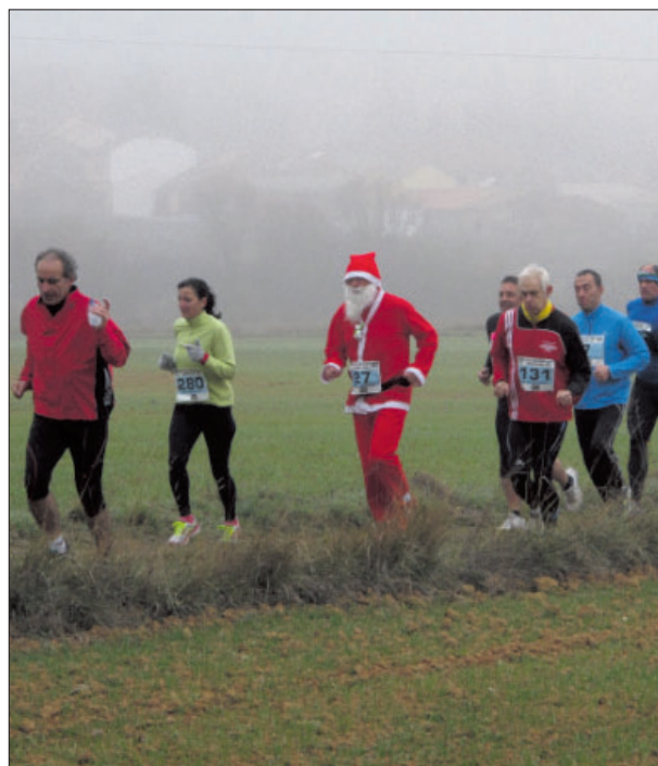
El 24 de diciembre se celebró la V legua y media de Bayubas de abajo. Una carrera en la que se batieron todos los récords: de asistencia de público, de inscritos y de recaudación para ASPACE. Algunos de los participantes no fallaron con sus disfraces/ ASOCIACIÓN CULTURAL EL RETORNO