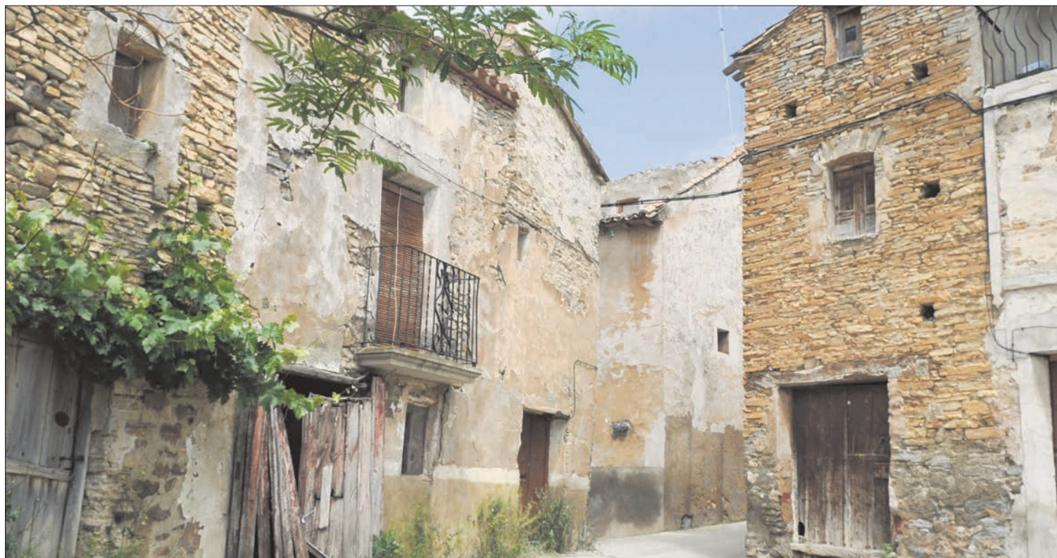
Valdeprado y sus calles vacías como ejemplo de la situación de muchos municipios de la provincia.

LUCHA CONTRA LA DESPOBLACIÓN Este Plan de la Junta no tiene nada que ver con la iniciativa que están impulsando FOES y otras organizaciones empresariales de Cuenca y Teruel, para que la Unión Europea incluya Soria en los programas de fondos económicos para territorios despoblados.