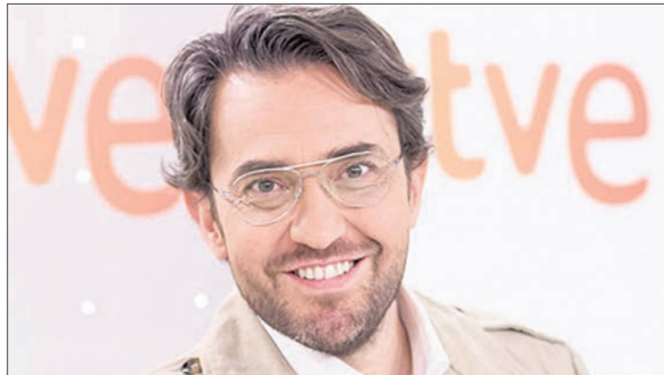
Maxim Huerta será el pregonero de este año.