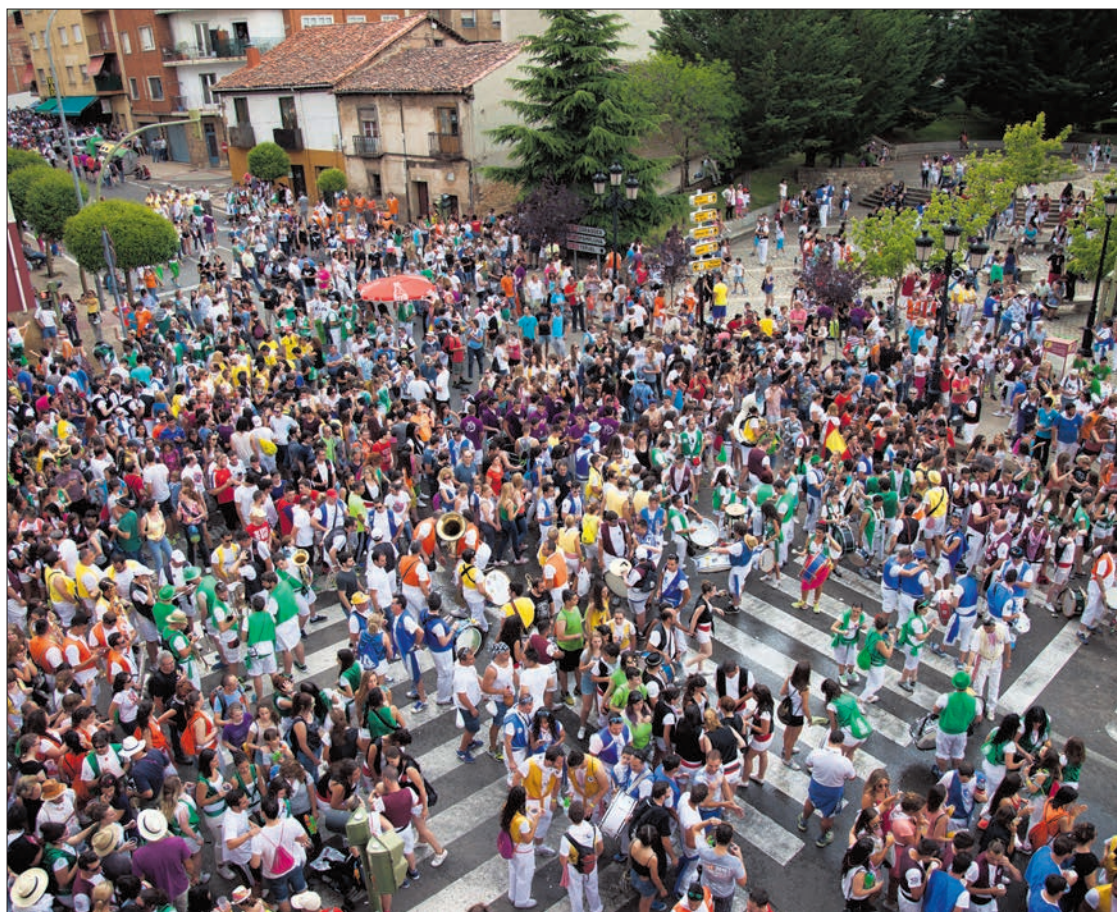
Peñistas y sanjuaneros bajan hacia el Duero hacia Las Bailas.