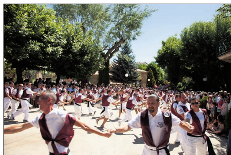
Los Que Faltaban abren el desfile de las peñas por su aniversario.