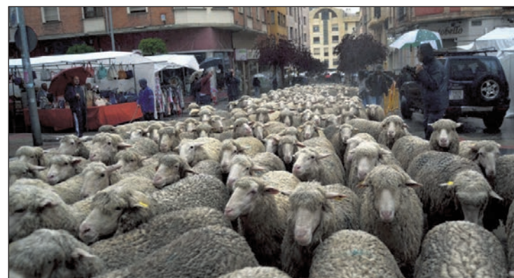
El rebaño a su llegada a la capital en anteriores años.

Los visitantes podrán disfrutar de actividades más gastronómicas como la elaboración de migas, de caldereta, o de queso, con degustación de queso de oveja de Oncala y embutidos de las Tierras Altas.