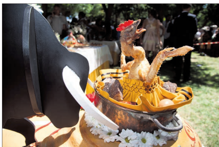
Imaginación y humor en la caldera de San Juan /D.A