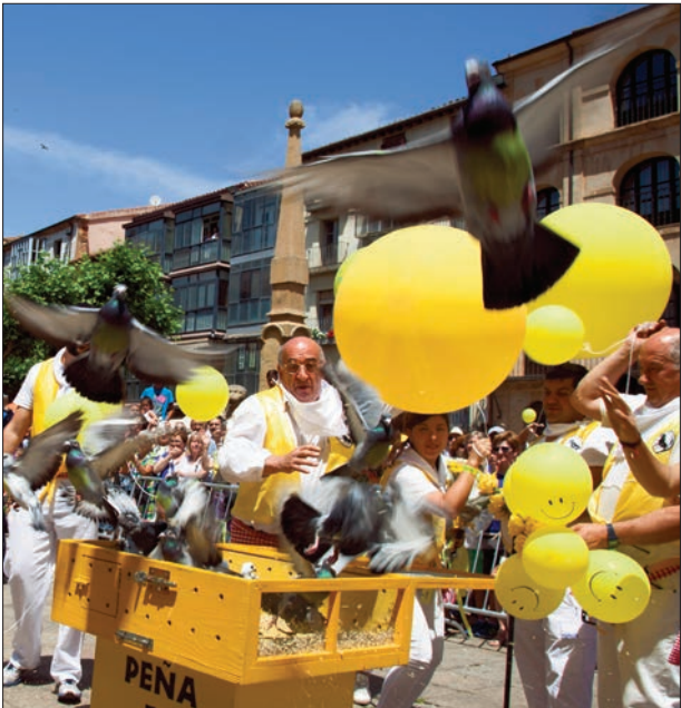
La suelta de globos y palomas del Cuadro una tradición más.