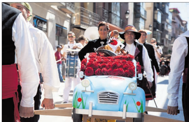
La caldera de San Miguel, un homenaje a los tastarros.