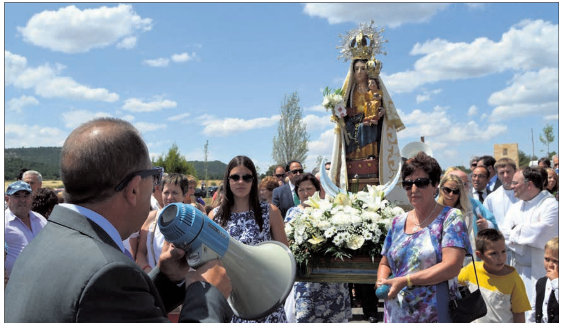
Imagen de la procesión con la Virgen de La Blanca por el entorno de la ermita, el pasado año.

En la extendida procesión, se subastan los banzos y las roscas