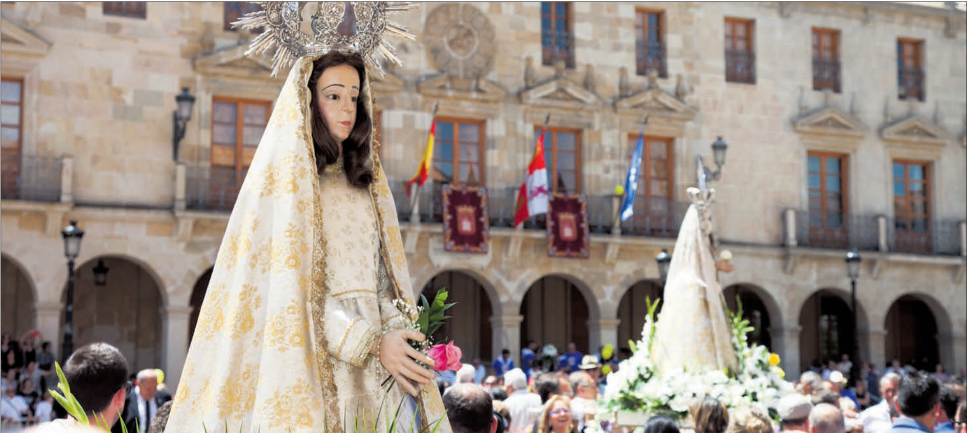
Como manda la tradición las vírgenes de La Mayor y La Blanca se dan la espalda ante el Ayuntamiento.