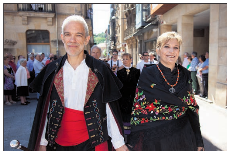
Los jurados de La Mayor con sus trajes tradicionales.