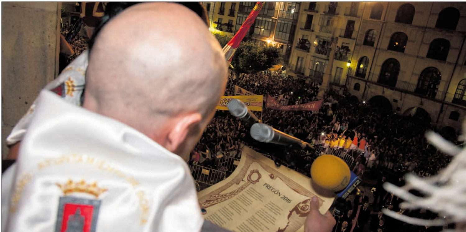
Los jurados de La Blanca dan inicio a las fiestas desde el balcón.