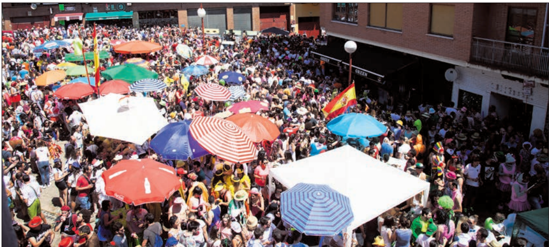
El otro lado del Viernes de Toros.