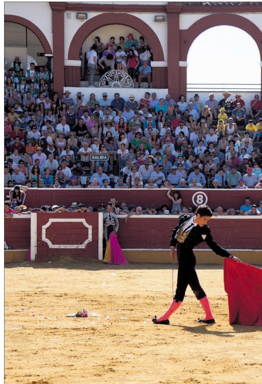
Sobre la arena del Coso de San Benito coinciden el viernes los novilleros tratando de demostrar su valía.

El Viernes de Toros es el 'climax' festivo de San Juan, que comienza con el Pregón del miércoles por la noche, y que continúa el Jueves La Saca, para terminar con el viernes de Toro. Cuando el ritual sanjuanero marca que las Cuadrillas en las que se distribuye la ciudad de Soria, tras traer los toros desde Valonsadero, mata su novillo a la espera del Sábado Agés. Son miles las personas que llegan el Viernes de Toros a la ciudad de Soria, coincidiendo con el fin de semana, de Castilla y León y otras comunidades vecinas, en buscar de la fiesta en su versión más pura. Un fiesta sin descanso, que se apoya en el festejo de la popular novillada que protagonizan las doce Cuadrillas. Seis torea su novillo por la mañana, y las restantes por la tarde.