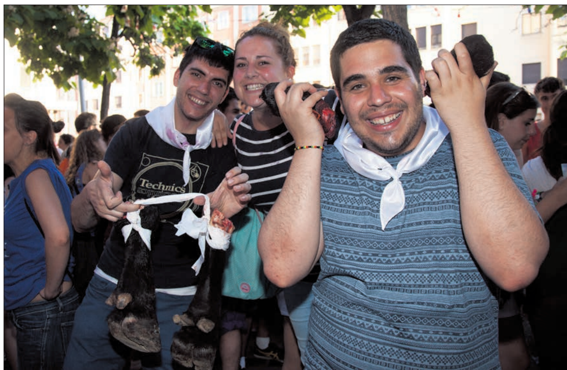
Mientras algunos pujan por la carne otros prefieren los despojos del toro. /M.F.