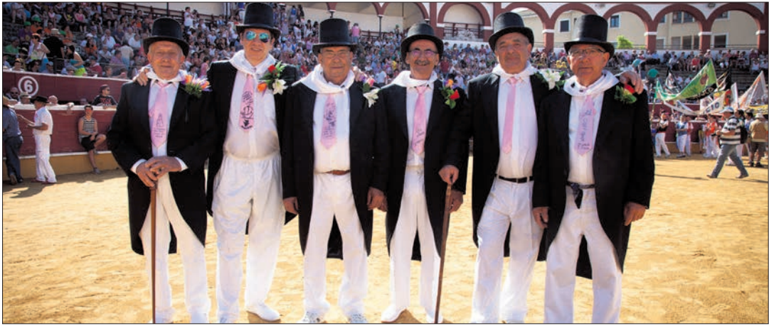
Un grupo de veteranos sanjuaneros disfruta de la fiesta.

Cada vez se cuida más la calidad de los novilleros que acuden al Viernes de Toros