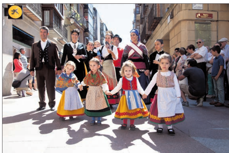
Familia de sanjuaneros desfila juntos por El Collado. /M.F.