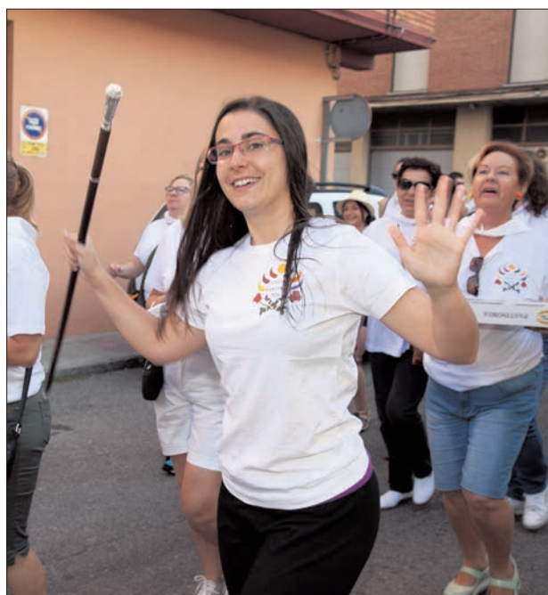
La jurada de Santiago es la única que durante los cinco días de la fiesta lleva su propio bastón. En esta cuadrilla tienen dos bastones, ¿el motivo? Hace años a una jurada un vecino le regaló un bastón, y esta decidió donarlo a la cuadrilla.