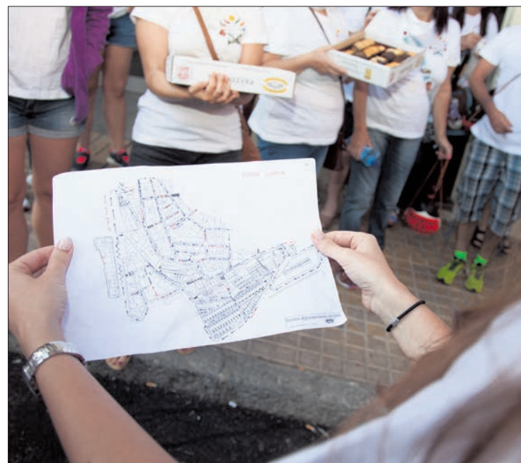
Recorrer todas las calles de cada barrio y las pedanías con la charanga, las botas, el santo y las calderas es una de las tareas de las Cuadrillas. Especialmente largas son las rondas del Jueves, el Sábado y el Lunes. /M.F.