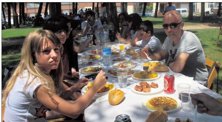
Comida popular en las fiestas de Camaretas en años anteriores.

Durante el verano, los vecinos de Cabrejas tienen una cita festiva con los días de 'El Mejillón'.