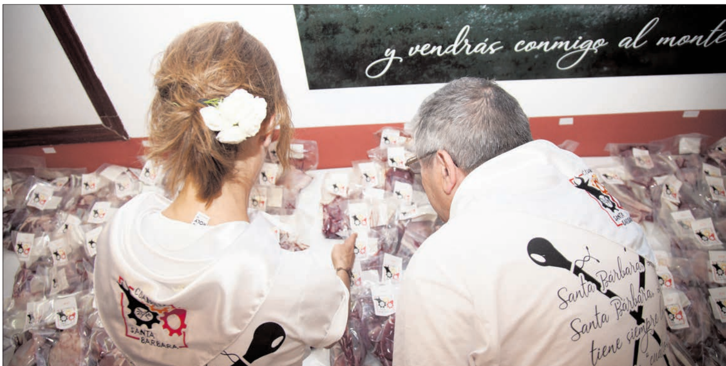
Dos colaboradores de Santa Bárbara reparten las tajadas durante la mañana.

Aunque ha habido valoraciones que advertían del peligro de que la subasta del Sábado Agés fuese a menos, basta recorrer las diferentes Cuadrillas para observar que los sorianos siguen dando un valor especial a este acto. Un festejo en el que el subastador tiene un papel significativo, para animar a los vecinos a que se acerquen, a que beban vino de la bota, y a que subasten al mayor precio posible. El compromiso de los sanjuaneros mantiene vivo el interés por la subasta de los agés. Lo único que ha pasado, en los últimos años, es que la subasta se está alargando un poco más, a la espera -por ejemplo- de que termine la corrida de toros, para que se incorporen más personas a la subasta.