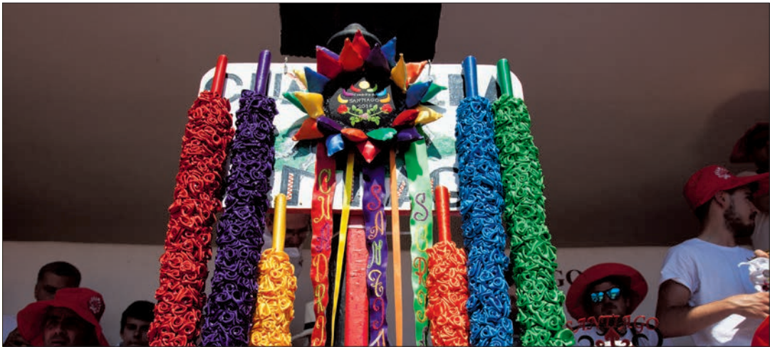
El cachitilo y las banderillas de la cuadrilla de Santiago. /M.F.