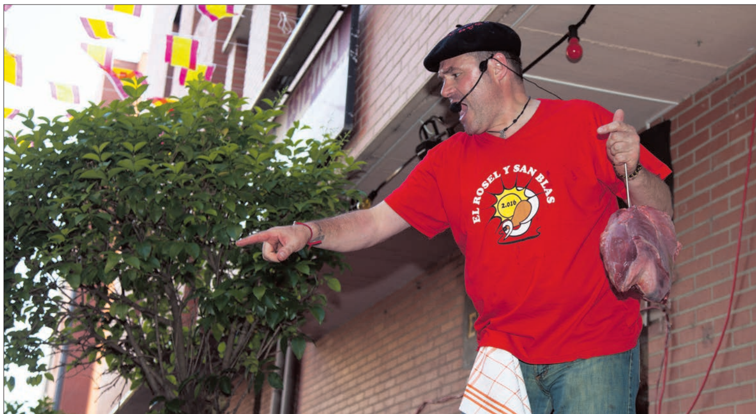
El subastador del Rosel y San Blas muestra una de las tajadas a los mozos. /M.F.