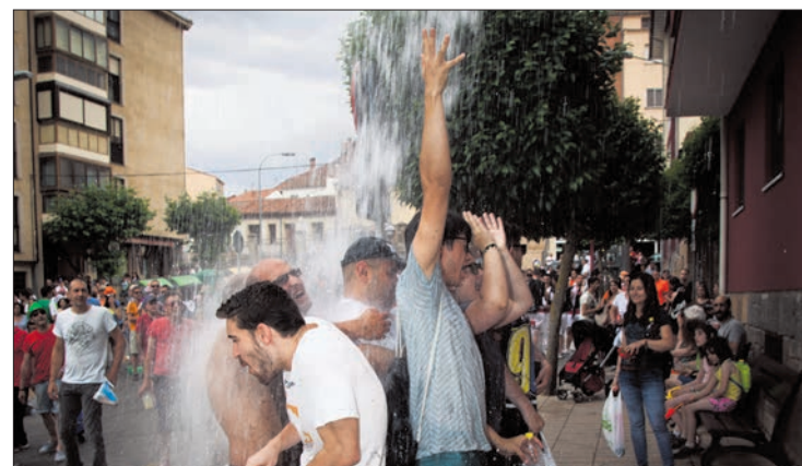
Varios sanjuaneros piden agua a los vecinos.