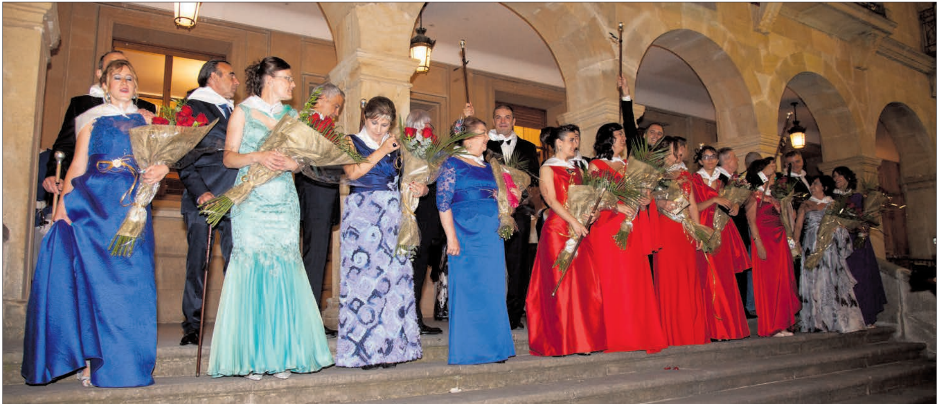
Los jurados, con sus trajes y vestidos de gala en las escalerillas del Ayuntamiento el miércoles después del pregón.