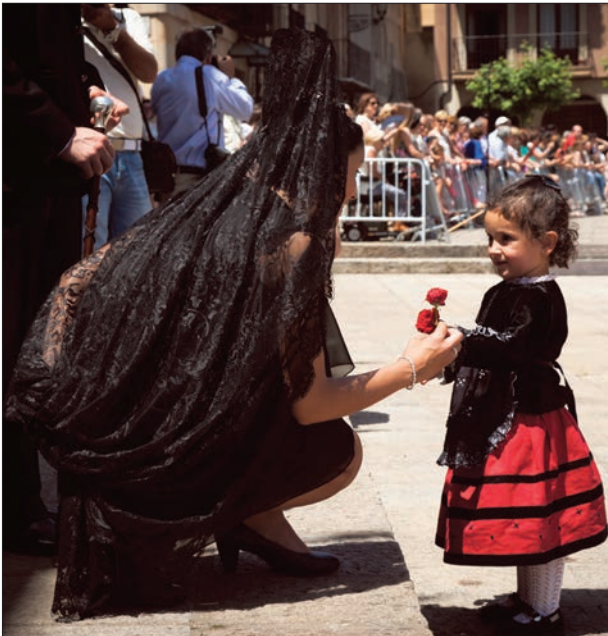
Una pequeña piñorra ofrece sus rosas a la jurada de La Blanca.