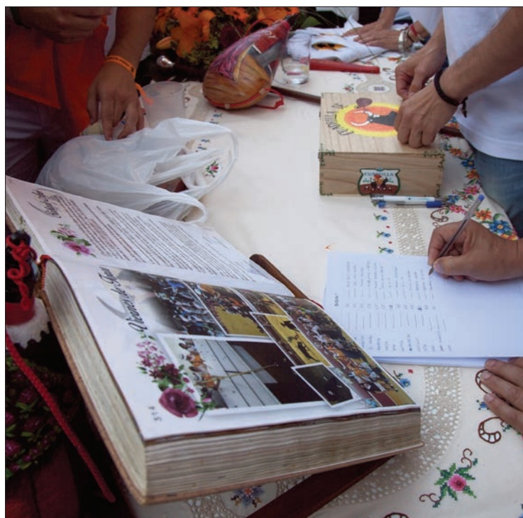
El libro de la cuadrilla y anotaciones de las pujas en La Mayor. /M.F.