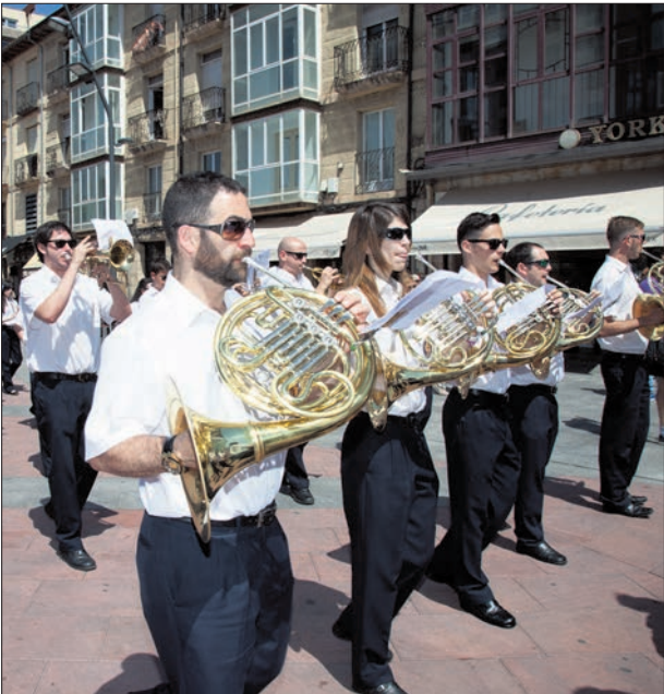
La banda municipal protagonista también en los desfiles.