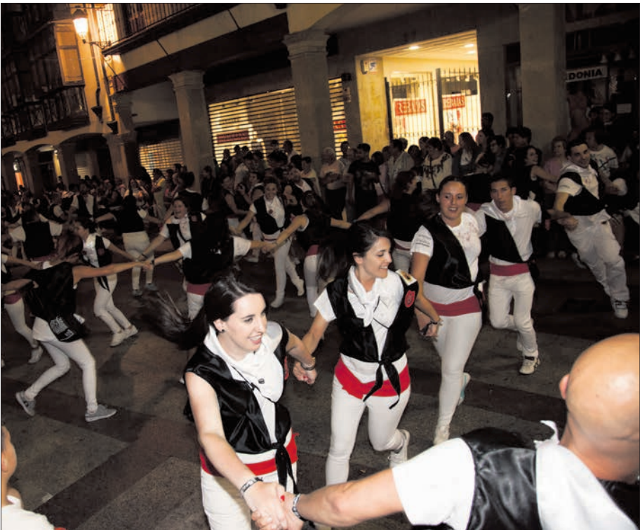
La peña El Desbarajuste desfila hacia La Dehesa.