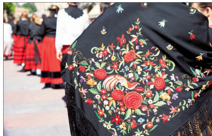
Las piñorras lucen sus mantones de ramo.