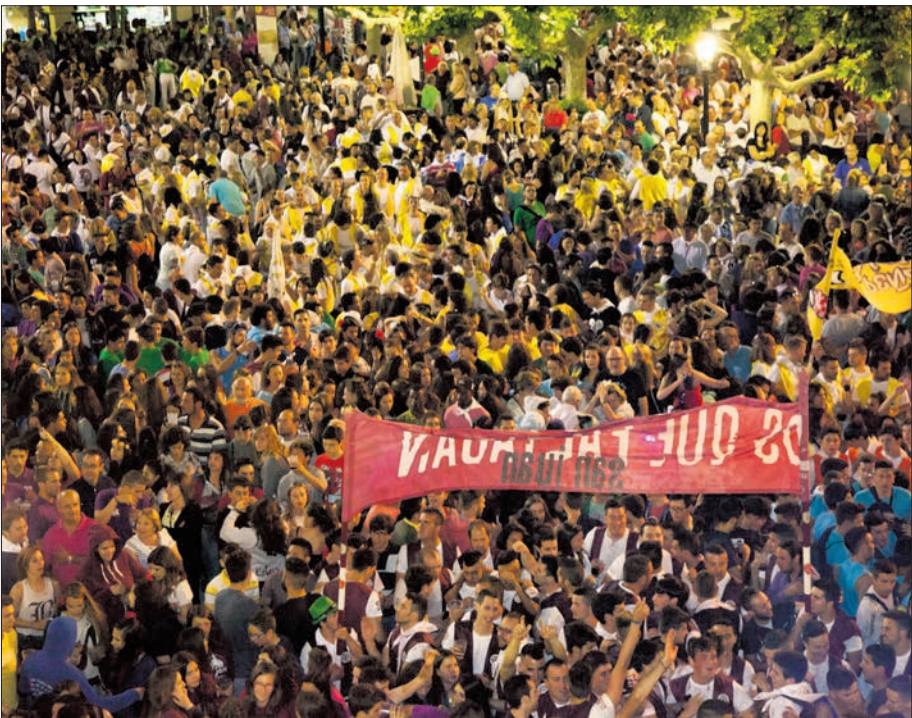
Las peñas son protagonistas también en la plaza durante El Pregón.