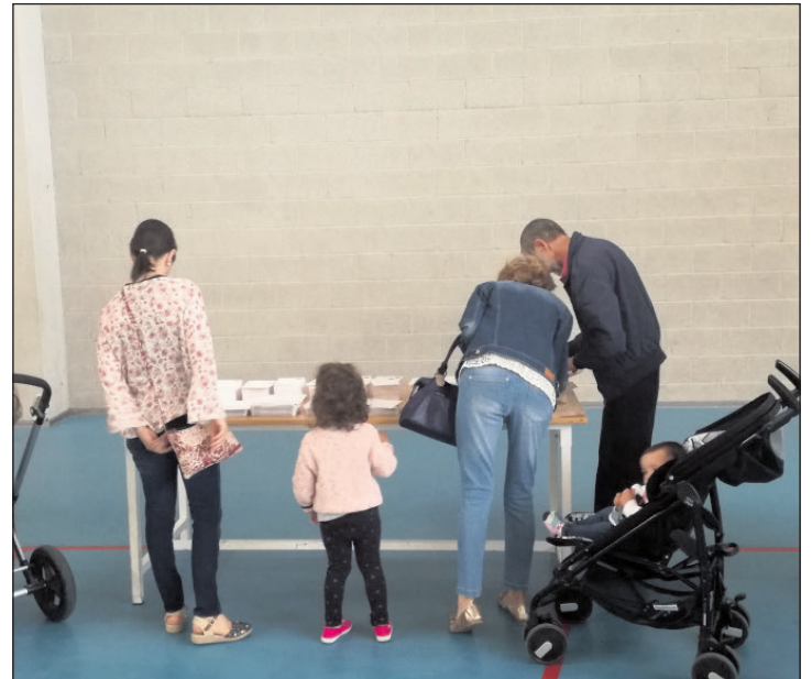
La jornada electoral se celebró sin incidentes en la provincia.