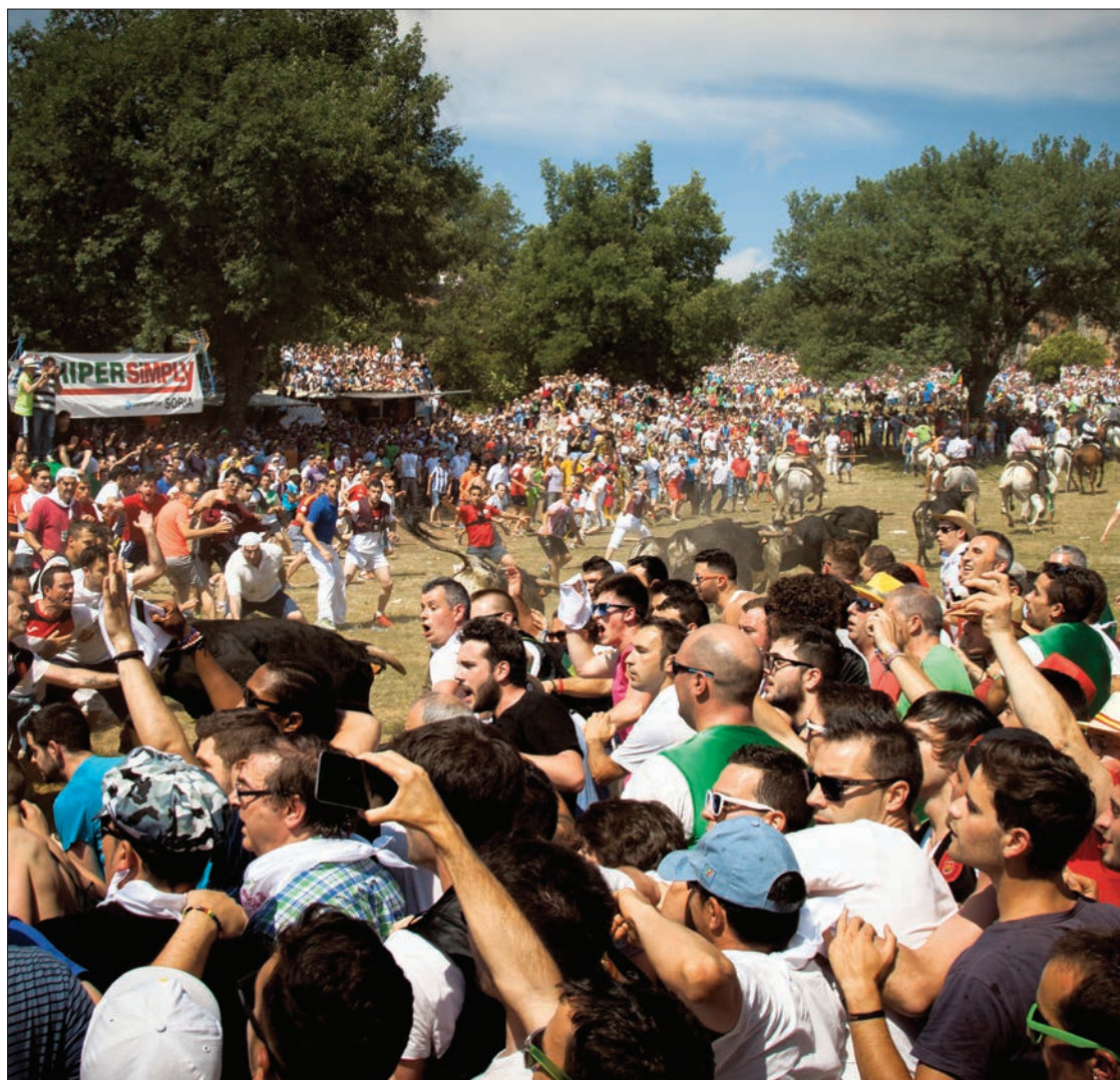
A las 12 del mediodía las fiestas de San Juan viven su momento más mágico.