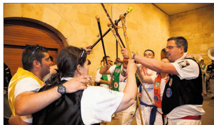
El tradicional baile de las peñas tuvo que realizarse a cubierto.