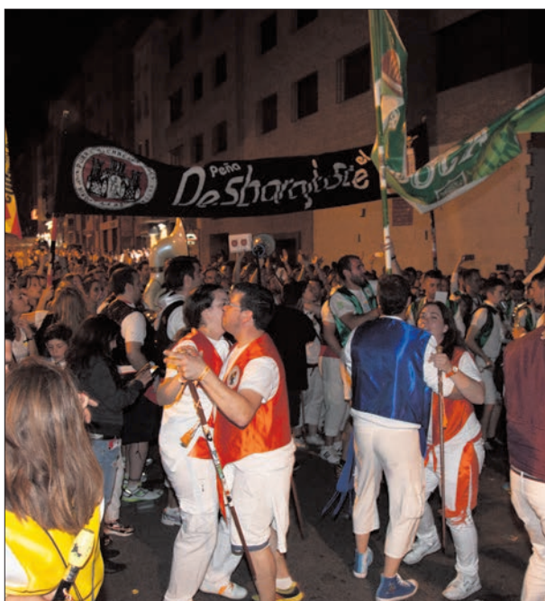
El Domingo por la noche, pasadas ya las 2 de la madrugada las peñas se encuentran en La Zona para compartir bailes. Lo que comenzó siendo un encuentro ocasional va camino de convertirse en un acto más en el que este año, por fin, participaron las 6 peñas