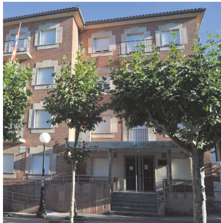
Imagen de la Biblioteca Pública de Soria.

El próximo viernes, a partir de las 12.00 horas, se inicia el club de lectura fácil con la participación de ASAMIS. El día 16 se realizarán dos sesiones del taller de escritura creativa, a las 10.30 y a las 12.30 horas, con alumnos del Colegio Santa Isabel, quienes también participarán, el día 18, en las II Olimpiadas bibliotecarias de títeres, que se celebrarán a las 11.45 horas.