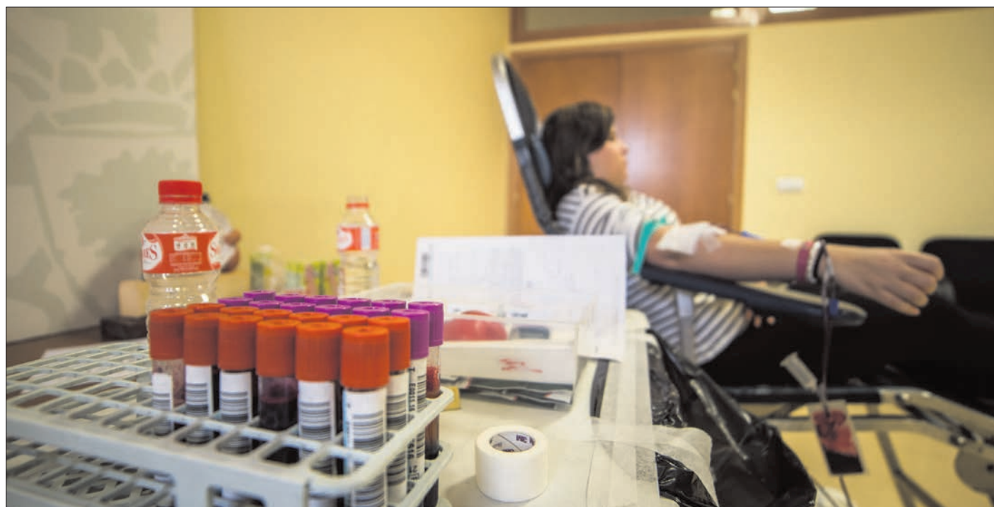
Detalle de una extracción de sangre durante el Día del Donante Universitario, en el campus de la capital.

para que el banco tenga reservas, ya que la sangre donada tiene que pasar por los laboratorios para ser analizada y no puede utilizarse en el momento.