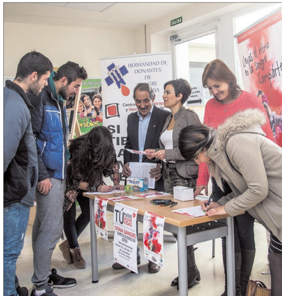
Miembros de la Hermandad de Donantes de Soria informando a los estudiantes en el 'Duques de Soria'. /c.v

El 90% de las intervenciones quirúrgicas necesitan sangre.