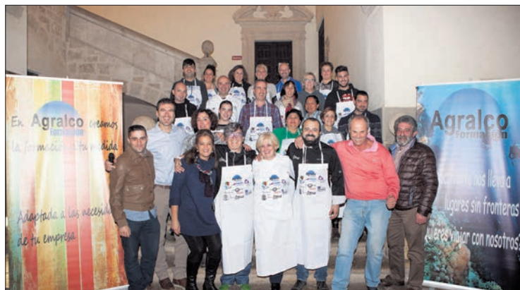
Imagen del grupo que participaba en la edición de 2015