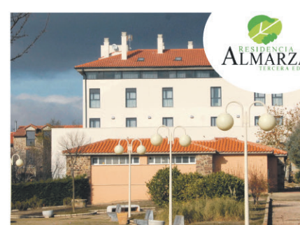
Residencia Almarza Tercera Edad C/ Marqués de Vadillo, 32. Almarza. Tfnos: Info: 975 227 786 - Residencia: 975 250 406 lagodetera@gmail.com