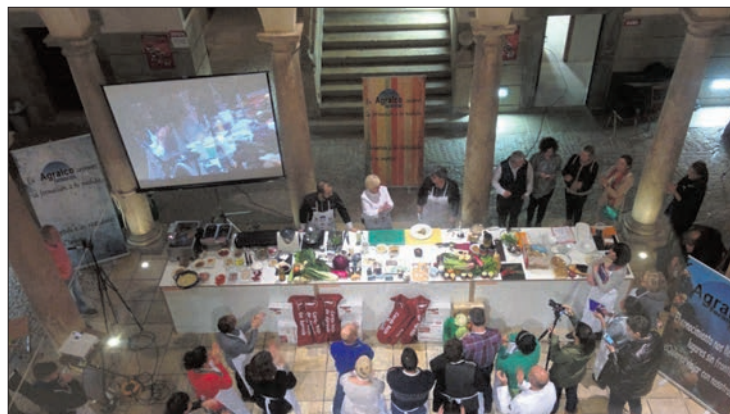
La cita gastronómica cuenta con gran participación de restauradores y público.