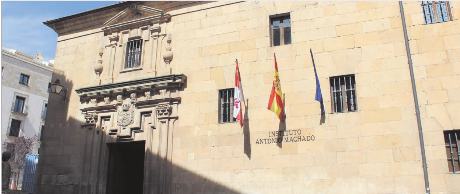
Imagen del Instituto de Educación Secundaria Antonio Machado en la capital soriana.

EL 25 DE NOVIEMBRE. Según el estudio 'Las pymes españolas en el ámbito online' realizado por eBay, el 25% de las pymes castellanoleonesas participará en el 'Black Friday' este año. Este porcentaje aumenta ligeramente en comparación a la media nacional que se sitúa en el 22,5%.