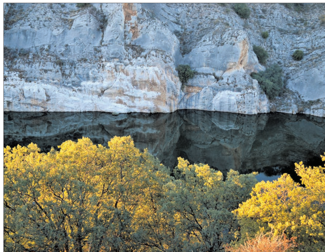
Imagen del cañón del río Duero en la localidad soriana de Los Rábanos.

Respecto a la flora, los senderistas pasearán a través de encinas, algún pino negral, espliego, cantueso y diversas variedades de tomillos, como el salsero.