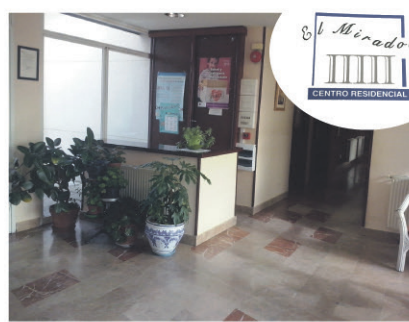
Centro Residencial El Mirador. C/Cerrada, s/n Valdeavellano de Tera. Tfno: 975 273 207