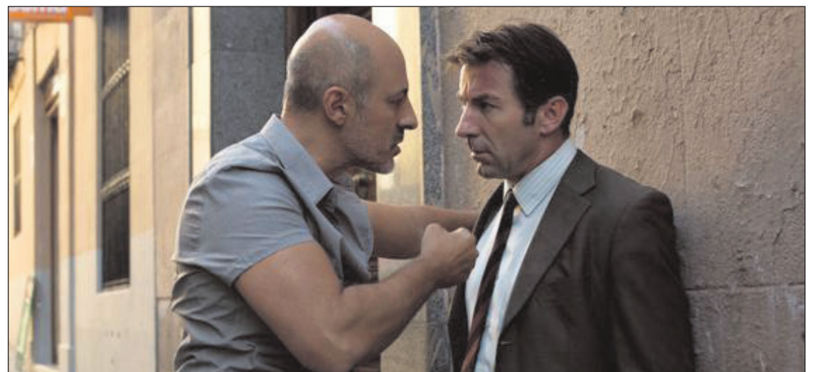
Fotograma de la película.

'Que Dios nos Perdone' es valorada positivamente por espectadores y críticos. De esta cinta se ha dicho que "es un thriller tan brillante como anómalo", que "La puesta en escena de Sorogoyen es vibrante, incluso frenética cuando es menester, y angustiosamente desasosegante. Confirma las buenísimas sensaciones que apuntaba en su anterior film. Las interpretaciones son brillantes". Estamos ante una película de la que seguramente se hablará mucho en los premios Goya y que tiene un gran aporte soriano.