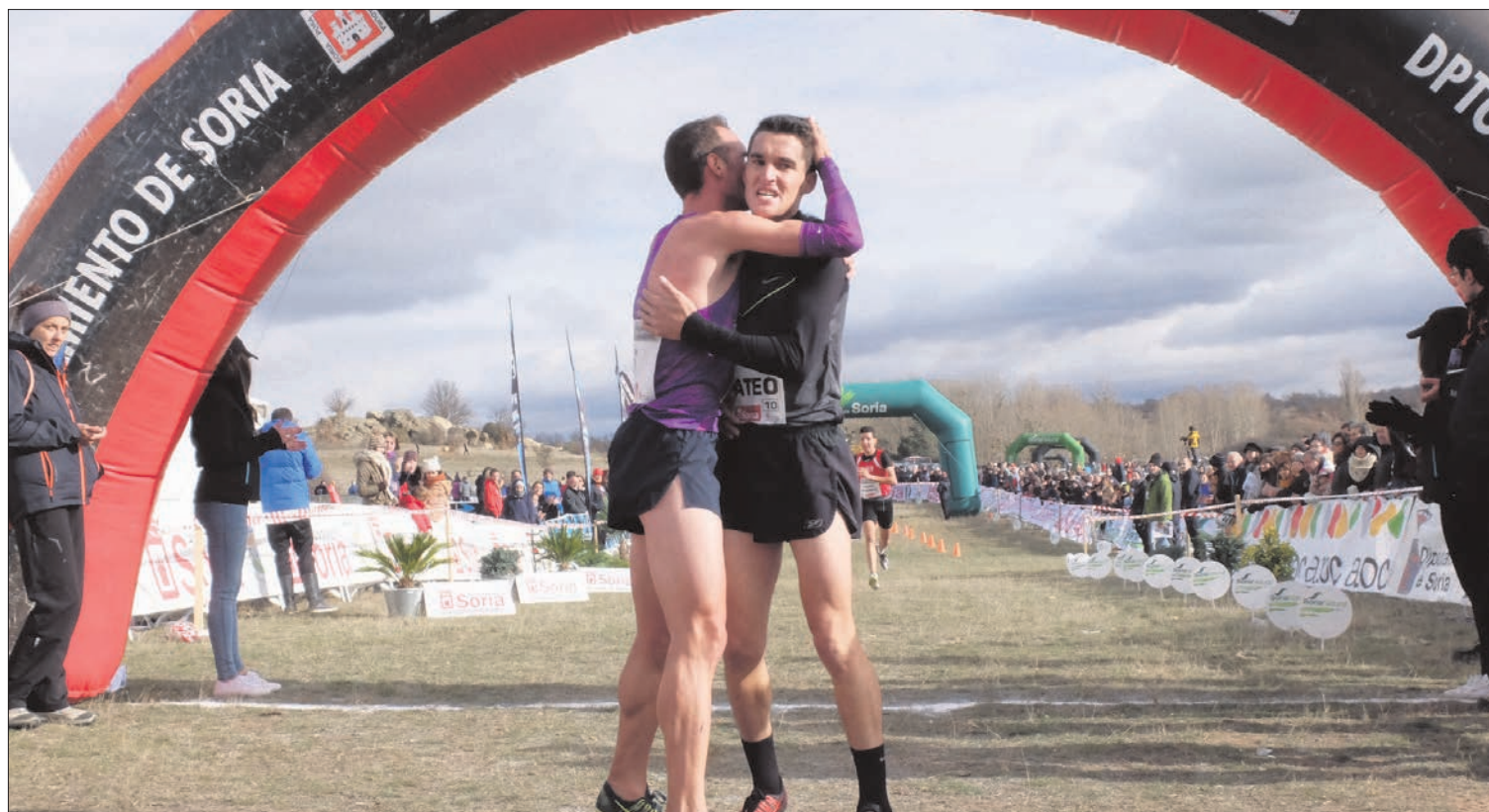
Imagen del Campo a Través Internacional de Soria, en ediciones anteriores. /CROSS DE SORIA

EL 17 DE NOVIEMBRE , concluye el plazo de inscripción para la vigésimo tercera edición del Campo a Través Internacional de Soria. Los atletas de las carreras federadas tendrán de plazo hasta las 24:00 horas de ese mismo día, mientras que los deportistas populares solo tendrán de plazo hasta el último del 16.