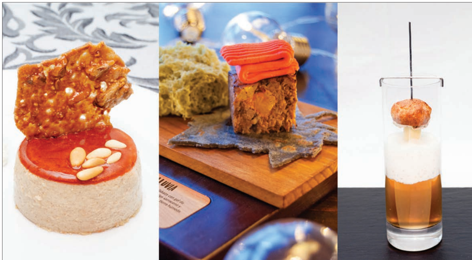
De izda a dcha: la tapa del restaurante Santo Domingo II, Crepería Lilot y La Chistera.