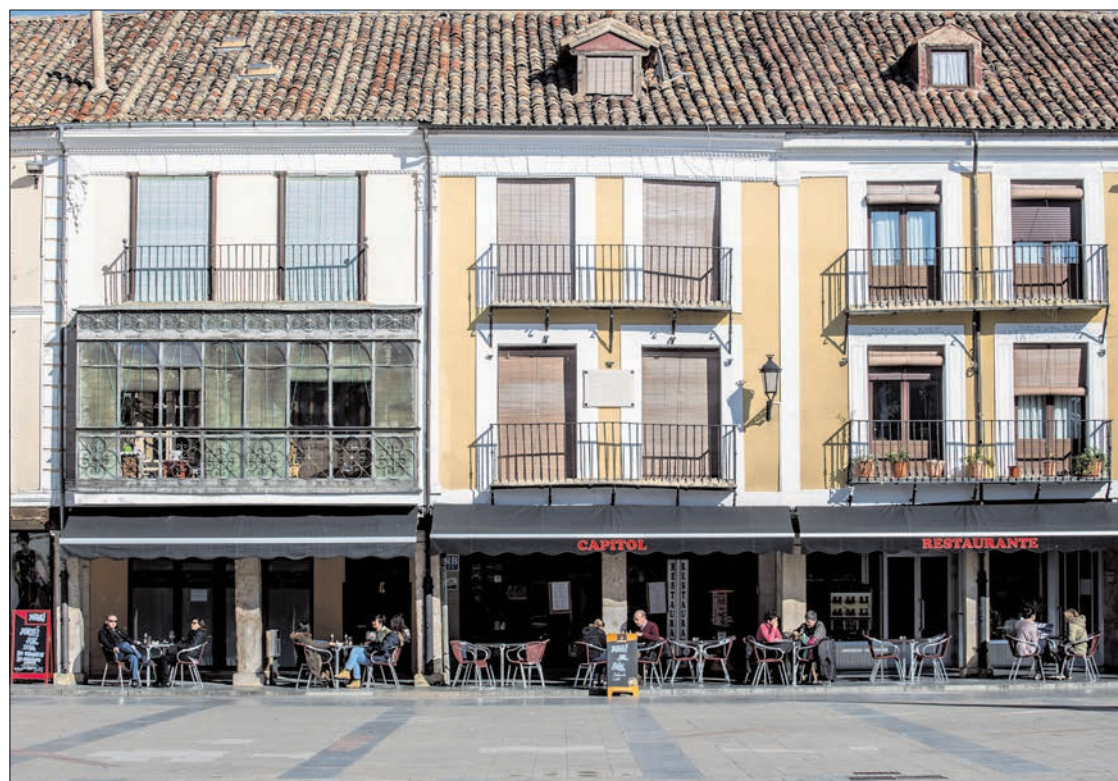
La localidad de El Burgo de Osma tiene un especial dinamismo, gracias al turismo y a un comercio vivo.

A nivel empresarial, se ha conseguido asentar el proyecto agrícola de Nufri, y se está trabajando para conseguir la estabilidad en Carbu-