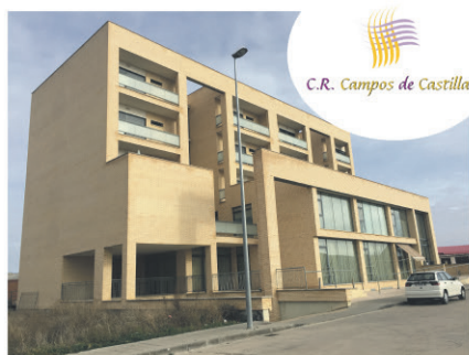
Centro Residencial Campos de Castilla Avda. Madrid s/n Almazán Tfno: 975 318 052 campos.de.castilla@hotmail.com