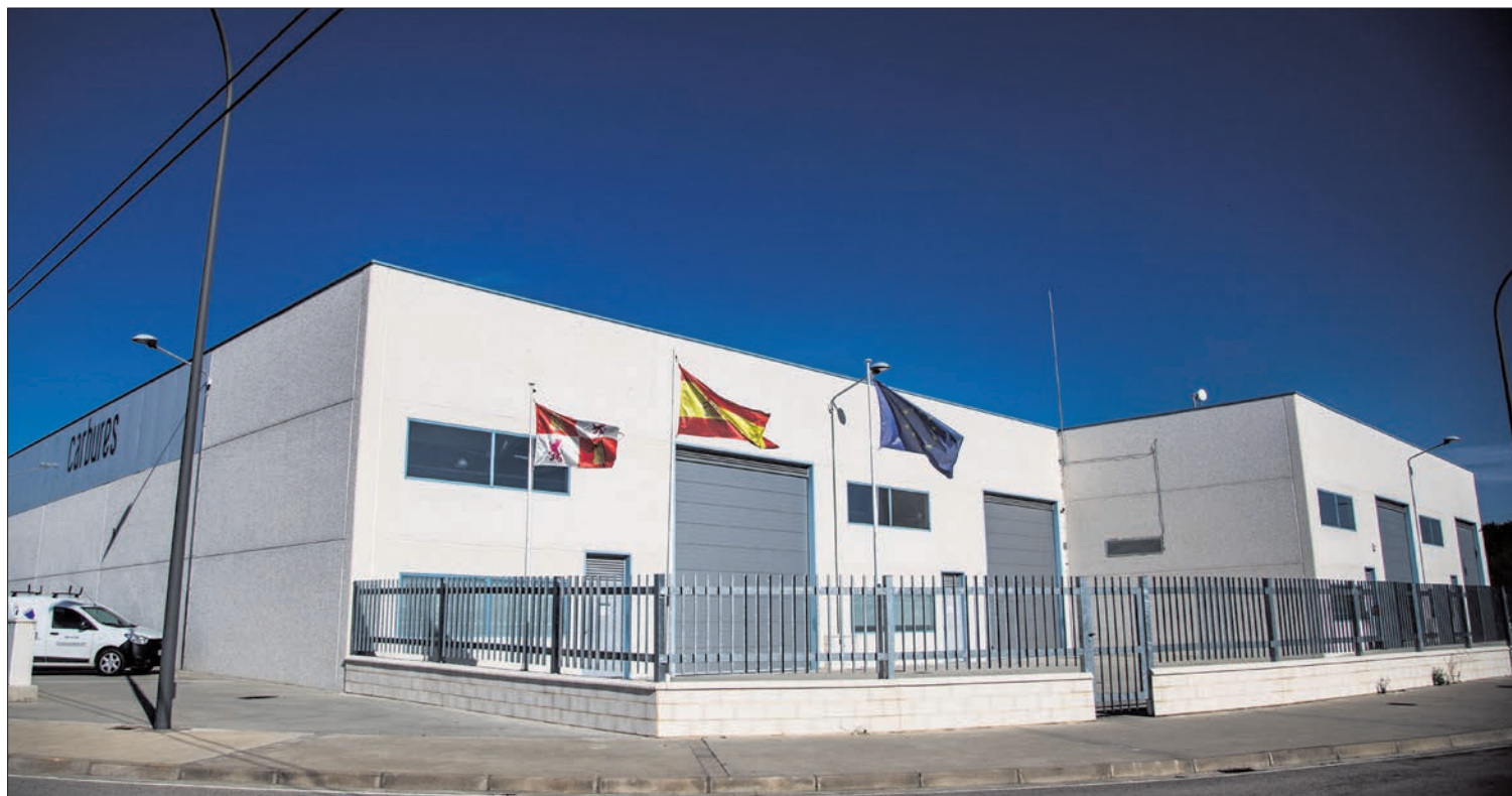
Nave municipal que El Burgo ha cedido a Carbures y que ya se ha quedado pequeña para las previsiones de desarrollo de la empresa.

CALIDAD. El Burgo de Osma es una de las localidades más dinámicas de la provincia, con una infraestructura turística muy completa, con establecimientos hosteleros de calidad y un comercio vivo y variado, para satisfacer a los numerosos visitantes.