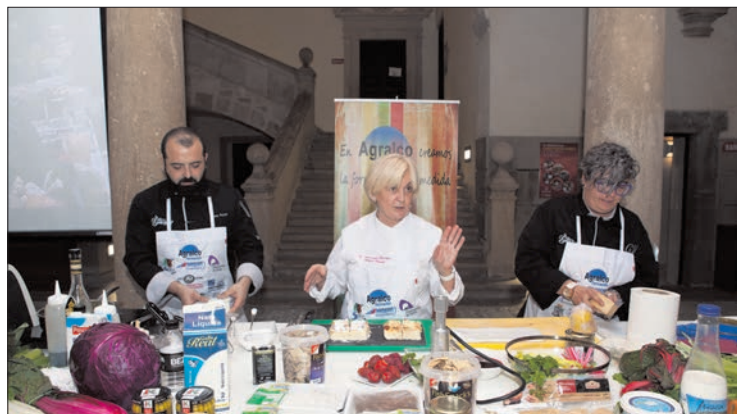
Durante las jornadas hay ponencias, exposición y encuentros en Ágreda