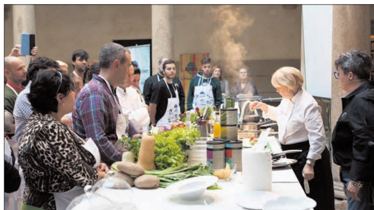
El Palacio de los Castejones engloba la exposición de productos