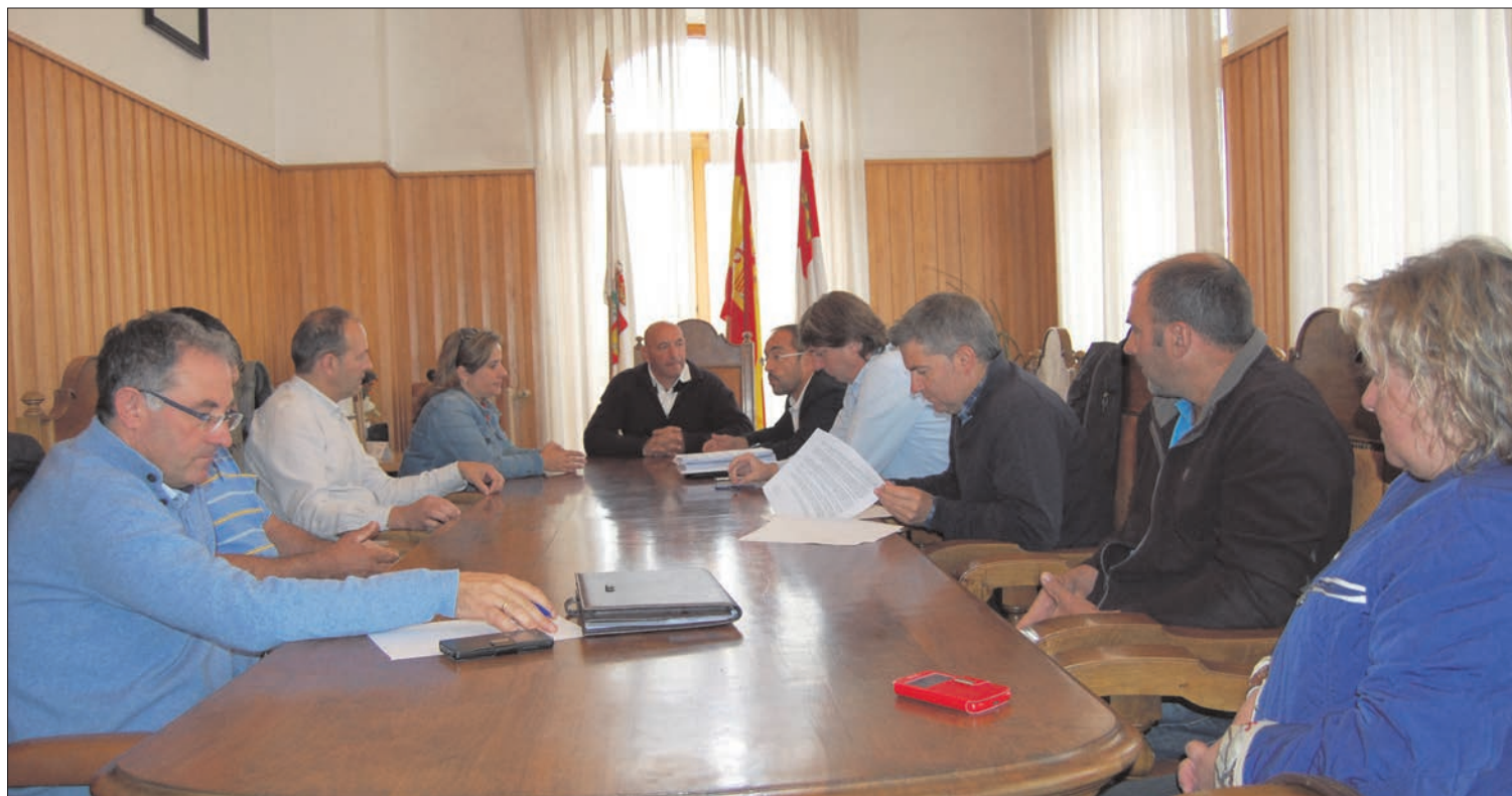
Alcaldes de municipios junto con el presidente de la Diputación de Soria.

MEDIO NATURAL. La posible localización de la estación de esquí sería en el paraje del Pico Urbión, uno de los más altos de la provincia de Soria. Un entorno natural rico en flora y fauna que hará que el estudio de impacto medioambiental sea fundamental en el proyecto.