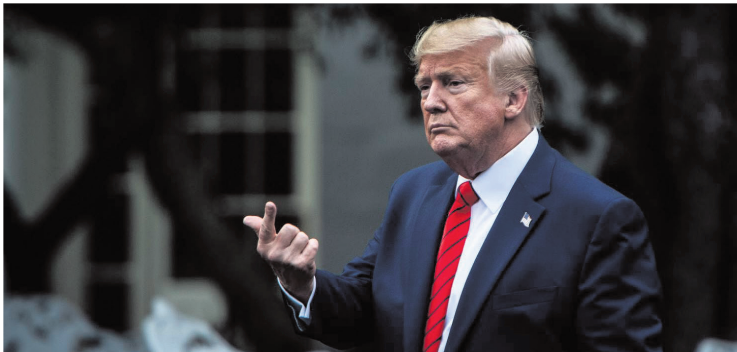
El presidente de EEUU, Donald Trump.

Según los datos recogidos de forma anual por la institución cameral, en 2016 las exportaciones desde Soria a Estados Unidos fueron por valor de 4,2 millones de euros con 280 operaciones. En 2017, subió la facturación por estas ventas hasta los 30,7 millones, aunque el número de operaciones se redujo a 252. Y en 2018 se desplomó de nuevo la facturación de las exportaciones hasta los 13,5 millones, aunque el número de operaciones se incrementó hasta las 322.