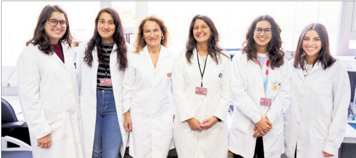
Investigadoras que forman parte del equipo de la Fundación para la Investigación del Cáncer de la Universidad de Salamanca.

CONVOCATORIAS anteriores. En 2017 y 2018 han resultado financiadas un centro de excelencia y tres unidades de excelencia. La Fundación para la Investigación del Cáncer de la Universidad de Salamanca recibió 2,1 millones de euros.