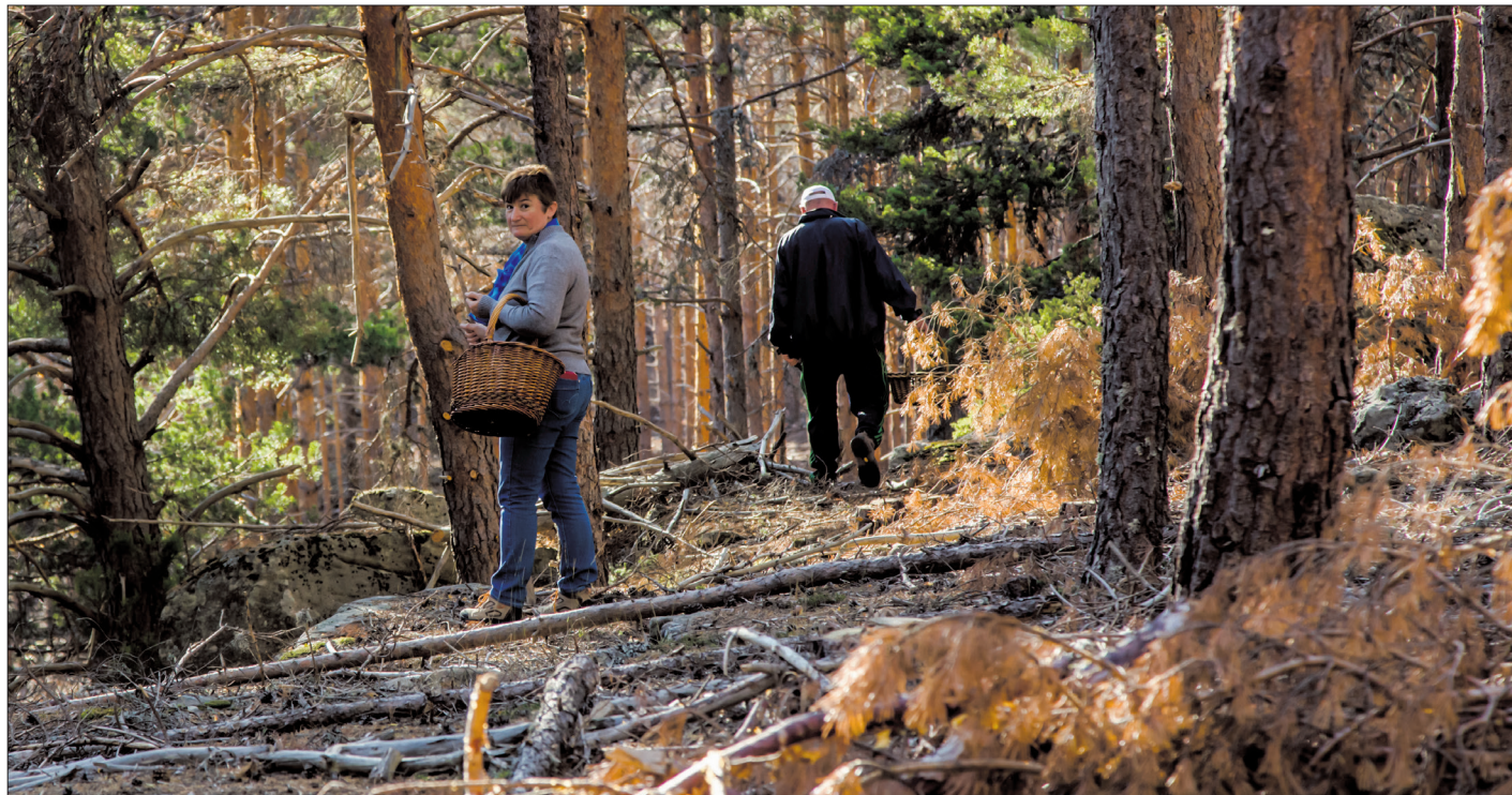
El objetivo del micoturismo es que los visitantes encuentren en el bosque un espacio para disfrutar y para conocer y respetar el monte.

Precisamente, han sido los abusos que se han producido por parte de los recolectores ilegales sin escrúpulos, o las malas prácticas de no pocos visitantes, que no son conscientes de la importancia de cuidar y respetar el bosque, lo que ha llevado a los propietarios de los montes a regular la actividad micológica, para velar por su continuidad en el futuro, ya que también es un recurso económico para los municipios.