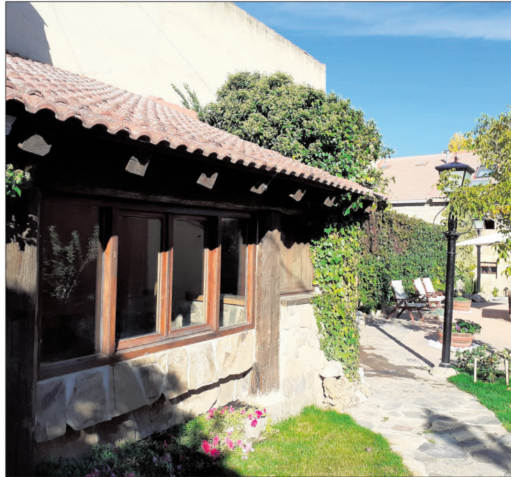
Nuevo centro de Asovica en Buitrago.