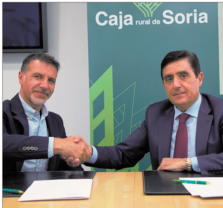
Gómez (izq.) y Martínez tras la rúbrica del convenio.

El convenio también incluye el apoyo a la Fundación CIEN (Centro de Investigaciones de Enfermedades Neurológicas) dentro del denominado Proyecto Alzheimer que acomete esta entidad en España.