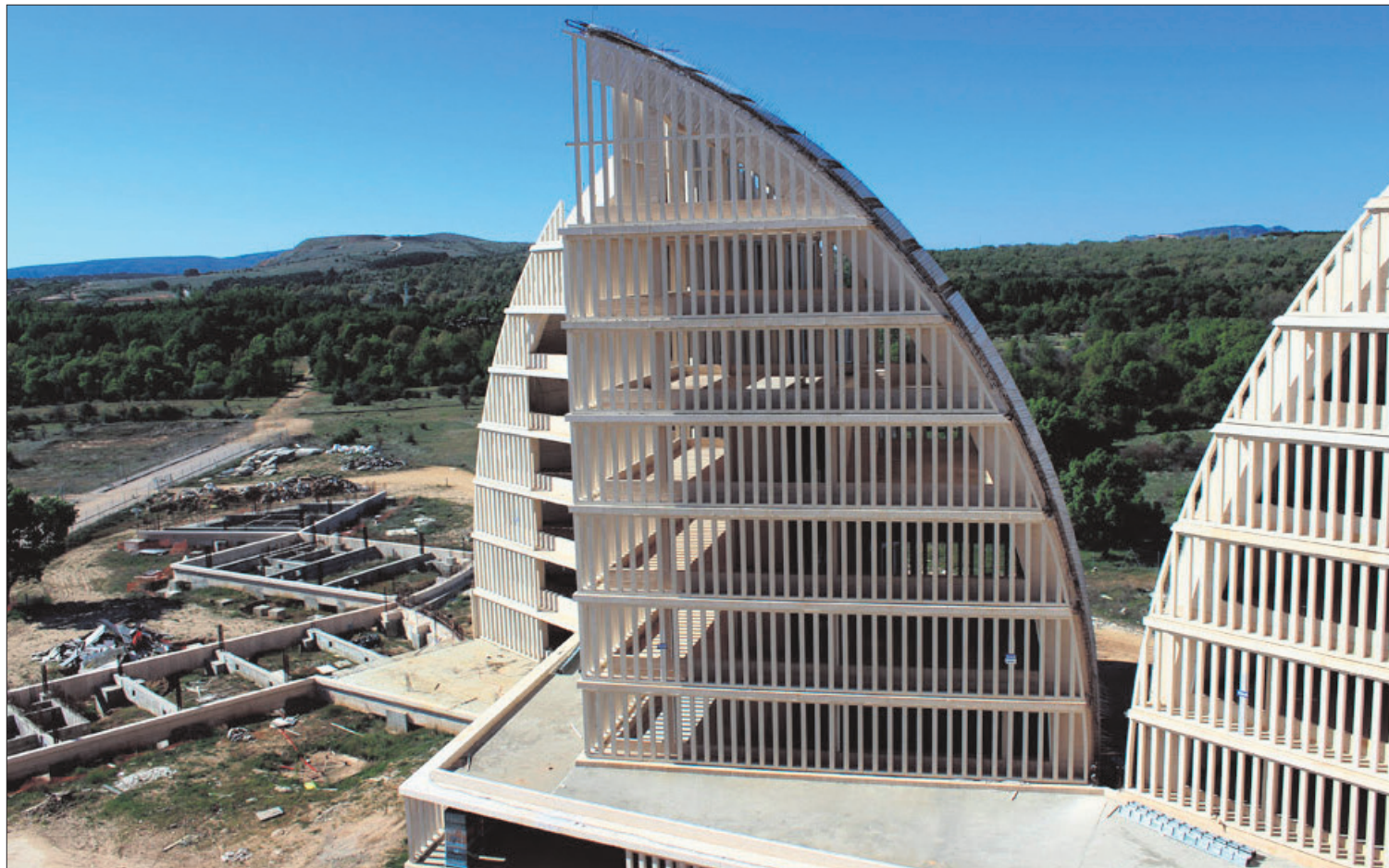
Imagen actual de las cúpulas del PEMA, terrenos judicializados por el recurso de Asden en el Supremo.

A través de esta medida que funcionará de forma telemática, se agruparán todas las tasas municipales y se fraccionará su pago en 9 meses, mas un décimo mes que servirá para la regulación de todos los pagos. Lo que se conseguirá es que “los vecinos de los pueblos de la provincia tengan la opción de pagar lo mismo por los tributos, pero sin acumularse en un mes que acaba resultando muy complicado para las familias, se pagará lo mismo pero con anestesia”, explicó gráficamente el presidente de la Diputación Provincial y también alcalde de Golmayo.