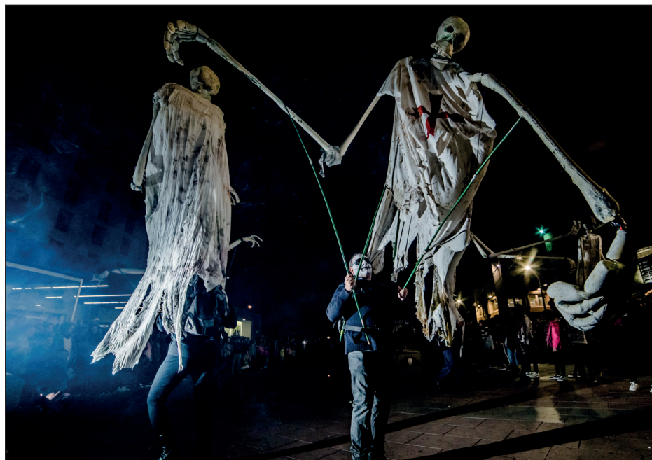
El desfile de la Noche de Difuntos espera este año más de 6.000 espectadores.