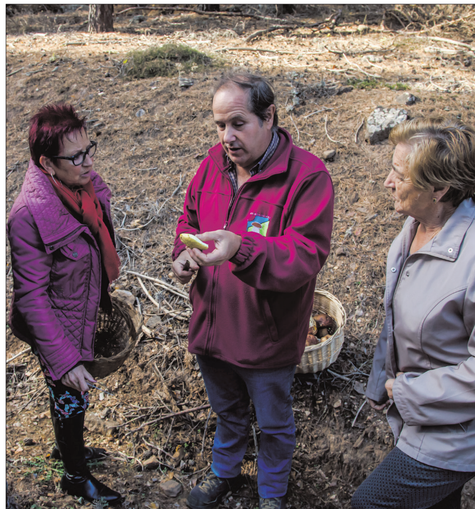
Explicación de un guía, en una salida de un grupo de micoturistas.

El cuarto coto que se ha creado es el 50.004 de La Póveda, con unas 2.700 hectáreas (para sacar permisos, entrar en la web del Ayuntamiento de La Póveda); y el quinto coto es el 50.005, llamado Quinto